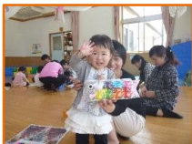
ばんだクラブ「こいのぼり作り」