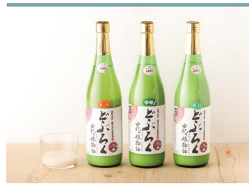
34 どぶろく由紀っ娘物語 【甘口・中辛・辛口】 農家レストラン由紀っ娘

米作りから製造販売まで夫婦二人三脚で行うどぶろく。自家栽培米と清らかな水を使い、麴を長期醸造するなど、製法も独自に研究し、米本来の甘みと濃厚さが際立った味に仕上がっています。さっぱりとフルーティで飲みやすく女性にも好評です。