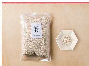
03 はだか麦 (一社)東温市観光物産協会

東温市産のもち麦ともち米を使った東温市の自然の恵みを生かした商品です。創業100年以上を支える、「野間商店」自慢のあんこと合わせることで、豊富な食物繊維を摂ることができます。美味しく健康にも気遣える、東温市らしい甘味です。