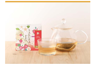
27 陽光桜茶 遠赤青汁株式会社

東温アルプスの麓、清涼な水と風に恵まれた棚田で育てられたカワラケツメイ。栽培期間中農薬は不使用で自然乾燥し、香ばしい風味に焙煎したノンカフェインのお茶です。弘法大師が修行中に健康茶として全国に広めたことに由来したネーミングです。