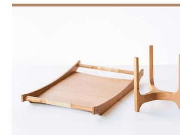
49 sips(sakura interior products) 【サービングトレイ・ポットスタンド】 木エノニエ

古くから花き栽培が盛んな東温市で育ったユウカリと井内地区に咲く紫陽花などをドライフラワーにしたフラワーアレンジ。オリジナルのモルタル鉢に東温市の四季折々の風景をイメージしながら表現しました。