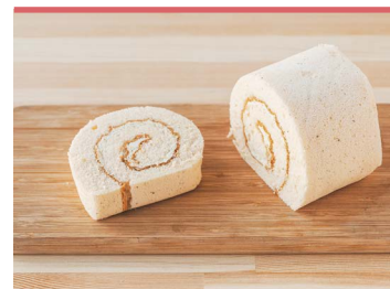
09 陽光桜ロール ベティ・クロッカーズ フジグラン重信店

瀬戸内海沿岸地域で古くから栽培されている、もち性のはだか麦、もち麦。東温市の「ジェイ・ウィングファーム」で栽培されたもち麦は「ダインモチ」という品種で、もちりした食感で冷めても美味しく頂けます。