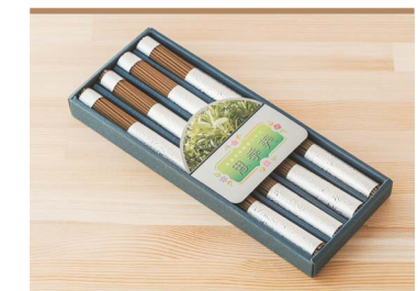
50 思季美 井内区人・空・棚田を活かす会

国産の無垢のさくら材を使用したインテリア木製品。伸びやかな曲線をデザインのエッセンスとし、伝統的な工法を取り入れながら現代のライフスタイルに溶け込む、日々の暮らしが少し豊かになるような製品を作り続けています。