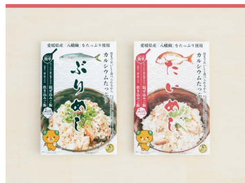
22 混ぜご飯の素 【ふりめし・たいめし】 株式会社キシモト

東温市で作られた「どぶろくながい」を使用した、しっとりもちり食感のマドレーヌ。すべて手作業で作られた、ふんわり酒粕が香る風味豊かな焼き菓子は、「ここにしかない味」として、ロングセラー商品となっています。