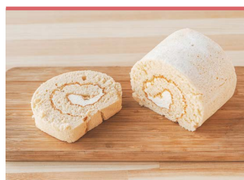
08 もち麦はったい粉ロール ベティ・クロッカーズ フジグラン重信店

東温市の「ジェイ・ウィングファーム」で栽培されたもち麦を使用した、素朴な味が魅力のパンです。愛媛県産の強力粉、卵もできる限り地域の養鶏場のものを使用。陽光桜パンとともに、東温市さくらの湯観光物産センターふるさと体験棟で焼き上げています。