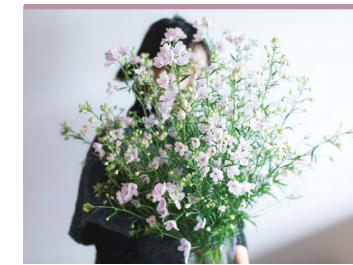
43 さくらひめ つゆぐち農園

生花がもつ本来の色彩をキープしたまま、花卉を落とさず花びらを固着することができる、特許製法の水溶液で作られたドライフラワー。東温市の地域産業資源に認定されている花「さくらひめ」に着目し、様々な商品化をしています。