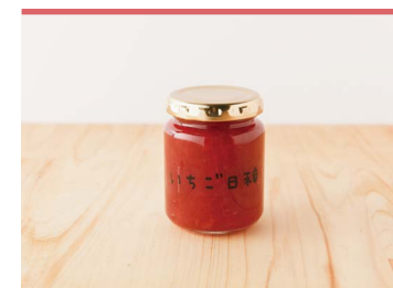
14 いちごのジャム 株式会社いちご日和

東温市で自家栽培した良質な米を使用し、独自製法にて製造されたどぶろく「由紀っ娘物語」を使用した、どぶろくプリン。添加物は加えず米本来の甘みと濃厚さを際立たせた、口当たりまろやかで甘めな仕上がりに。味は、甘口と中辛の2種類あります。