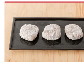
11 もち麦入りあんこ餅 野間商店

東温市横河原で和菓子店を営む「野間商店」が作る、はだか麦入りのお餅。東温市内で作られたもち米とはだか麦を蒸して、一緒につけています。プチプチした歯切れの良い食感、素朴な味わいで食事にもデザートにもぴったりです。