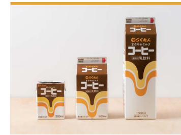
25 らくれんコーヒー 四国乳業株式会社

1968年に誕生して以来、大人から子どもまで多くの方に愛飲されているコーヒーです。コーヒー豆を東温市の清らかな地下水で抽出しました。愛媛県内の学校給食でお馴染みの、らくれん牛乳と同じデザインを使用したパッケージです。