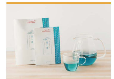
33 タニニーケ 美し茶 ドガビンファーム

農業・化学肥料を使わず自家生産・自家加工にこだわる色鮮やかなブルーのハーブティー。抗酸化作用のあるアントシアニンが豊富に含まれる7月中旬～10月初旬に収穫されるパタフライビーと温州みかんフレックをティーバッグにしました。