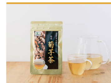
31 焙煎 菊芋茶 遠赤青汁株式会社

会社が設立された昭和43年から製造を続けるロングヒット商品。原材料に練乳を使用した、まろやかな口あたりのクリームソーダです。東温市のどぶろくと割ると、とても飲みやすいと好評をいただいています。