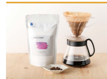
28 sakura blend "vin rosé" ヴァン ロゼ MOUNTAIN STREAM

東温市で栽培した陽光桜の葉と有機黒糖を組み合わせたオリジナルティーです。香料や着色料は不使用。素材の味や香りを損ねないように、遠赤外線を使用して乾燥させています。優しく香り立つ桜の風味をお楽しみください。