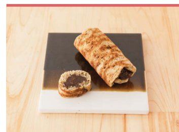
12 陽光桜とら巻 野間商店

生地には東温市産のもち麦粉、愛媛県産の強力粉を使用し、さらに茹でたもち麦を練りこんだベーグル。ほのかに香ばしい素朴な風味、もちりしたシンプルなパンでありながら、噛んだ時にプチッと弾けるような食感が楽しめます。