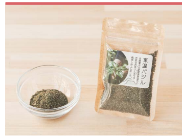
20 東温バジル 東温かんきょう農園

全国的にも珍しい、無添加でオーガニックな生パスタ専門の製麺所が作る、東温市産大麦粉を使用した生パスタのシリーズ。東温市産もち麦粉・はだか麦粉をそれぞれ20%配合。加水を最小限にし、他にはない歯ごたえを目指しています。