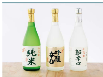
38 小富士 【純米・吟醸辛口・超辛口】 島田酒造株式会社

自家栽培の棚田米を使ったどぶろくを仕込む「農家レストランぼたん茶屋」が作る「どぶろくながいとうおん桜」。全国的にも稀有なソメイヨシノから培養した秋田県の「美桜酵母」を使用した、華やかで気品ある、香り豊かなどぶろくです。