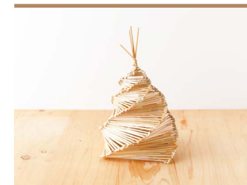
45 ほたるかご (一社)東温市観光物産協会

東温市特産のもち麦のわらを利用し、昔から子どもの手遊びとして受け継がれてきた「ほたるかご」を制作。麦わらは、消毒など薬剤は不使用で自然の素材をそのまま生かしています。全て手仕事によるもので、それぞれが1点ものです。