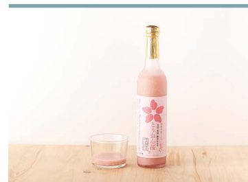
37 どぶろくながい とうおん桜 農家レストランぼたん茶屋

東温市井内地区は、山里の美しい水と寒暖の差がある気候で育つ美味しいお米が自慢の地。この地域で自家栽培した棚田米と清水を原料に作られたどぶろくです。華やかな香りフルーティな風味、程よい酸味もあるすっきりとした味わいです。