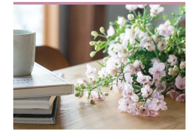
44 とうおんしあわせ便 東温市商工会女性部

「さくらひめ」は、愛媛県の農林水産研究所で11年の歳月をかけて育成されたデルフィニウムの新品種です。淡いピンク色をした桜を連想させるような可憐な雰囲気の花を、ビニールハウスで栽培しています。