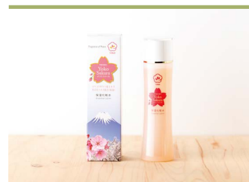
40 陽光ローション 遠赤青汁株式会社

ビタミン・ミネラルのバランスが良く緑黄色野菜の王様とも言われる愛媛県産有機栽培ケールを100%使用し、自社にて栽培・加工を行う無添加の青汁です。飲みやすい粒タイプとお菓子や料理作りにも使える粉末タイプがあります。