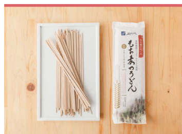
04 もち麦のうどん 五色そうめん株式会社

愛媛県は、はだか麦の生産量日本一。瀬戸内海沿岸地域でとれるはだか麦は特に高品質とされ、東温市の「ジェイ・ウィングファーム」では生産から、粒立ちや形状にこだわった精麦加工まで、一貫して行なっています。