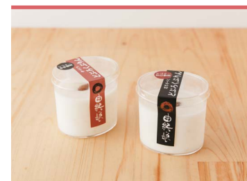
13 どぶろくプリン 【甘口・中辛】 農家レストラン由紀っ娘

東温市横河原の地で製造を続ける「野間商店」。表面にトラ模様が入った同店名物菓子の生地と東温市産の陽光桜葉の粉末を混ぜ込み、桜の風味豊かな和菓子に仕上げました。自家製の粒あんと、甘さ控えめの生地の組み合わせが絶妙です。