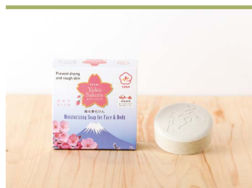
41 陽光夢石けん 遠赤青汁株式会社

東温市で自社栽培した陽光桜の葉とエキスを配合した化粧水。保湿力があり、伸びもよく角質に浸透し、つけ心地はさらっとしています。桜の樹皮は医薬品、葉は医薬部外品成分の原料として登録されています。