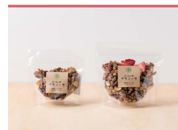
16 もち麦はったい粉グラノーラ ひととき

東温市の豊かな水を使い加工された、カルシウムたっぷり、骨まで柔らかく食べられる干物です。塩分50%カットで、電子レンジや湯煎などで簡単に調理ができます。魚種は様々、塩味、みりん味、パジル味など各種あります。