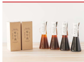
23 媛甘露 【白米・赤米・黒米・緑米】 有限会社ジェイ・ウィングファーム

「まるとと」の技術を利用して、中骨までやわらかく食べることができる混ぜご飯の素。愛媛県産の養殖のブリと鯛をそれぞれふんだんに入れました。あったかいご飯に混ぜるだけの簡単調理も時間がない時にとても助かります。