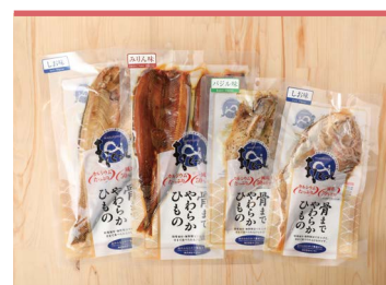
15 骨まで食べられる干物『まるとと』 株式会社キシモト

愛媛県が国内で有効の生産量を誇るもち麦とはだか麦。これらを粉末状にしたものをロール生地に練り込み、はだか麦茶をじっくり煮出した、甘さ控えめの生クリームを巻き込みました。口に入れた途端広がる香ばしい香り特徴です。