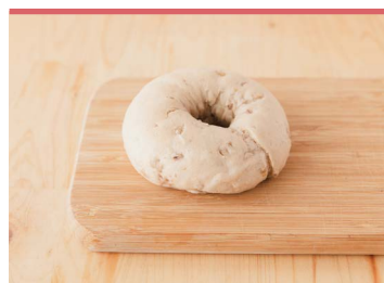
05 もち麦ベーグル (一社)東温市観光物産協会

東温市産のもち麦、国産の小麦粉と塩のみで作られたうどんです。もちもちした食感が特徴で、温かいても冷やしてもOK。もち麦を約4割練りこむことで食物繊維がたっぷり。100gで成人一日の摂取量の1/3が摂取できます。