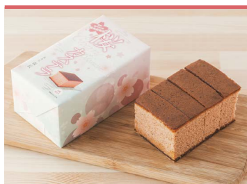
24 陽光桜カステラ (一社)東温市観光物産協会

自社農園産の原料のみを使用した麦芽糖。麦芽糖は、発芽したはだか麦を乾燥させ、粉にしたものを炊いたもち米に合わせた上澄液のことです。使用するもち米により味や色が変わり、安心安全で低カロリーな甘味料としてお使いいただけます。