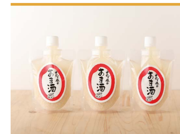
29 由紀っ娘のあま酒 農家レストラン由紀っ娘

東温市の穏やかな自然とたおやかでやさしいイメージ、また、未来への可能性を感じるクリーンな空気感をスペシャルティコーヒーのブレンドで表現しました。ロゼワインのように柔らかさの中に華のある風味と味わいです。