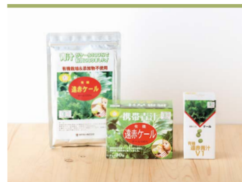
39 遠赤青汁VI 有機遠赤ケール 遠赤青汁株式会社

ビタミン・ミネラルのバランスが良く緑黄色野菜の王様とも言われる愛媛県産有機栽培ケールを100%使用し、自社にて栽培・加工を行う無添加の青汁です。飲みやすい粒タイプとお菓子や料理作りにも使える粉末タイプがあります。