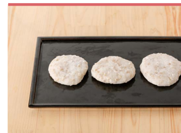
10 はだか麦入り餅 野間商店

東温市生まれの陽光桜の葉をパウダー状にしたものを、ロール生地と生クリームに練りこみました。陽光桜葉の素材自身を最大限に生かすためにも人工甘味料などは一切使用せず、天然の桜葉の風味を生かすことで上品な風味に仕上がりました。