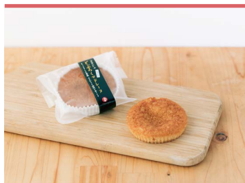
21 どぶろくマドレーヌ パティスリーカフェ心結

有機肥料を中心とした栽培を心がけ、コンパニオンプランツや木酢液など効果的な病害虫防除で育てたバジルを乾燥させました。高品質なバジルを収穫するための確かな時期を考慮し、市内の農家の主婦が丁寧に選別をしています。