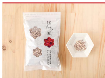
02 暖もち麦 (一社)東温市観光物産協会

松山平野の源流、白猪の滝や雨滝の清流水で育てられた味・安心・品質を追求する河之内の棚田米。農業・化学肥料不使用のひのひかり、世界最大の米コンクールで金賞を受賞したにこまる、コシヒカリ、ひめの凜の4品種があります。