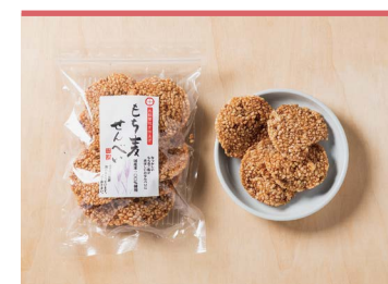
17 もち麦せんべい 有限会社 ジェイ・ウィングファーム

東温市産のもち麦はったい粉や、季節の自家製ドライフルーツが入ったグラノーラ。栄養価が高く健康志向の方にも手軽に食べてもらえるよう、有機オートミールやきび砂糖、豆乳など厳選の素材で作られています。