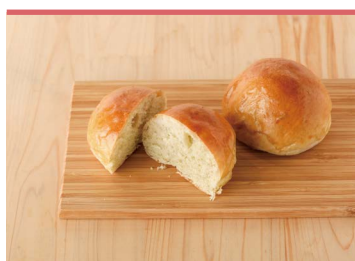
06 陽光桜パン (一社)東温市観光物産協会

自家農園で作るいちご「紅ほっぺ」を煮詰めた、いちご農家のジャム。保存料、添加物は使用せず、いちご、グラニュー糖、レモン果汁のみで仕上げた、「紅ほっぺ」そのものを食べているような甘酸っぱさが特徴。ヨーグルトに入れるのもオススメです。