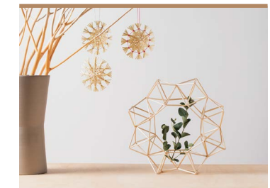
47 ヒンメリ・ストロースター Straw-Lyrics

世界中のプロからアマチュアまで、多くのユーザーから支持を得るダーツブランド「コスモダーツ」を展開する、コスモ精機。ダーツ用品の製造・販売を手がける同社が東温市の市花「桜」をモチーフにしたデザインでフライト(羽)を彩りました。