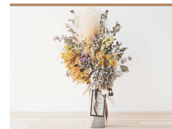
48 Dry flower モルタル花瓶アレンジ core dryflower & pilatis

東温市産のもち麦・はだか麦の茎を使用したオーナメント。北欧・フィンランドではクリスマスツリーに掛けたりモビールとして住空間に飾られます。温かみがあり、ユニークな幾何学パターンは暮らしに彩りを与えます。