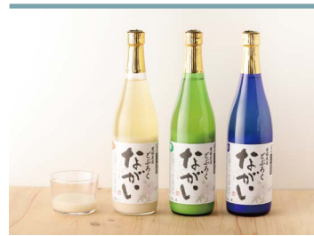
36 どぶろくながい 【甘口・中辛・辛口】 農家レストランぼたん茶屋

自家栽培米を使ったどぶろく工房で作られる「はな由紀」は、赤色酵母（酵母が赤い色素をもつ天然のもの）を使用した美しいお酒。他のどぶろくに比べて低アルコールで酸味があり、爽やかな飲み口が特徴で、食前酒にもぴったりです。