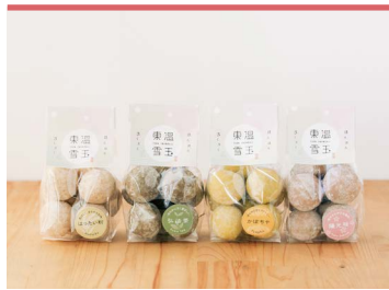
18 東温雪玉 【もち麦はっぴい粉・まめっこ弘法茶・かぼちゃ・陽光桜】 (一社)東温市観光物産協会

愛媛県産薄力粉、なたね油、砂糖といったシンプルな素材を使うことで東温産素材が生きる、ほろほろ食感のスノーボール。食品添加物や香料はなるべく使わず、各素材を粉末にし、混ぜ入れることで素材本来の香りを最大限に生かしています。