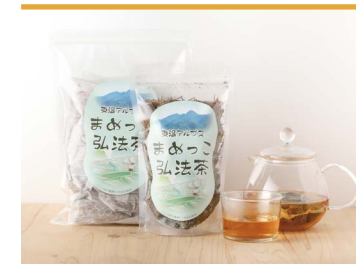
26 まめっこ弘法茶 キラッとかわのうち

1968年に誕生して以来、大人から子どもまで多くの方に愛飲されているコーヒーです。コーヒー豆を東温市の清らかな地下水で抽出しました。愛媛県内の学校給食でお馴染みの、らくれん牛乳と同じデザインを使用したパッケージです。