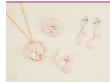
42 さくらひめのドライフラワー 合同会社ぐらしあす

生花がもつ本来の色彩をキープしたまま、花卉を落とさず花びらを固着することができる、特許製法の水溶液で作られたドライフラワー。東温市の地域産業資源に認定されている花「さくらひめ」に着目し、様々な商品化をしています。