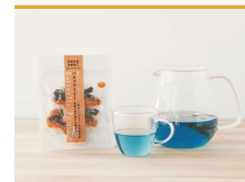
32 青のヒーリングティー 温州みかん ふうりんplus

有機認定を経た安全な農地で育てられた菊芋を丸ごと使用した、菊芋茶。菊芋は水溶性植物繊維であるイヌリンを多く含み、また、ビタミン・ミネラルも豊富であるため健康を意識する方から注目を集めています。無添加・無着色・無香料の安心製法です。