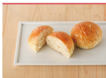
07 もち麦パン (一社)東温市観光物産協会

陽光桜は昭和56年に品種登録された東温市生まれの桜です。その桜の葉を手摘みし、乾燥・粉砕されて作った陽光桜葉パウダーを生地に練りこんで焼いた、ほんのり桜の香りのするパンです。また愛媛県産の強力粉を使用しています。