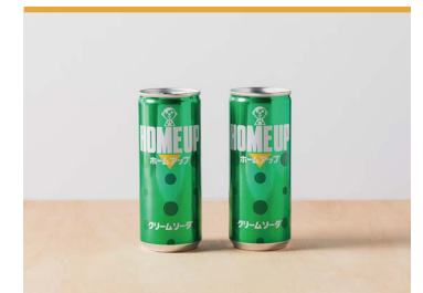
30 らくれんホームアップ 四国乳業株式会社

石鎚山系の麓で自家栽培をした良質な米のみを使用した、どぶろくの蔵元が作る甘酒です。麹由来の自然発酵食品として、ミネラル豊富でノンアルコール・低カロリーな調味料として、飲用はもちろん、様々な料理にも利用できます。