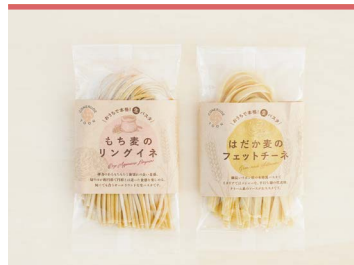
19 東温市産大麦の生パスタ 【もち麦のリングイネ・はだか麦のフィットチーネ】 CONERUDE TOON

愛媛県産薄力粉、なたね油、砂糖といったシンプルな素材を使うことで東温産素材が生きる、ほろほろ食感のスノーボール。食品添加物や香料はなるべく使わず、各素材を粉末にし、混ぜ入れることで素材本来の香りを最大限に生かしています。