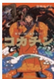
ココチン 著 / 佐知 みずえ

大分市在住の妹と共同で作家活動を始め、「江戸の空見師嵐太郎」が第33回読書感想画中央コンクール指定図書に選ばれた。今回の作品を「自分の子どもの頃からの夢が詰まった作品」と話す芝さんの新作に注目だ。