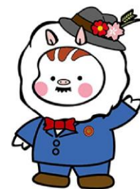
桑島市イメージキャラクター いのとん