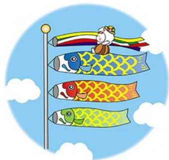
東温市イメージキャラクター いのとん