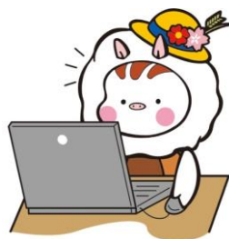
東温市イメージキャラクター いのとん