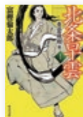
北条早雲 青雲飛翔篇 著/富樫倫太郎

小さい頃から活発で盗賊を倒し都に行き、さまざまな事件を起こす後の北条早雲こと伊勢新九郎。1巻は特に展開が多いのでオススメです。