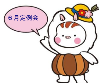
東温市イメージキャラクター いのとん

公有地の拡大の推進に関する法律第22条第1項の規定に基づき、議会の議決を求めるもの