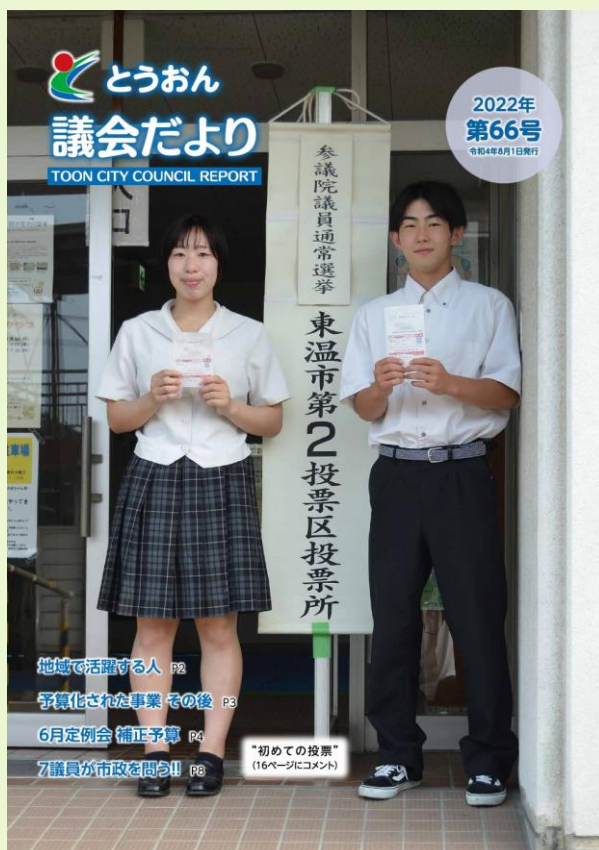
【表紙の写真】 “初めての投票”