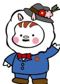
東温市イメージキャラクター いのとん