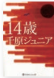
14歳 著/千原ジュニア

千原ジュニアの中学生時代を描いた本。中学生の頃から好きで読んでいます。同じ世代で共感する場面があるので中学生に読んでもらいたいです。