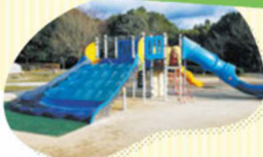
幼児広場(ツインドーム東)