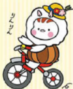
東温市イメージキャラクター いのとん

親子が気軽に楽しめる場所として、市内には3つの児童館があります。各児童館では親子体操、お話し会、自由工作、ベビーマッサージ教室など楽しいイベントがたくさんありますので、ぜひ足を運んでみてください。子育て世代の親同士の交流の場としても人気のスポットです。