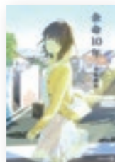
余命10年 著/小坂 流加

茉莉は不治の病にかかり、余命10年と宣告される。趣味に没頭する中で恋愛をしないと葛藤する茉莉。皆さんにも感動を味わってほしいです。