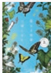
愛なき世界 著/三浦 しをん

青年・藤丸が慕うのは植物の研究に一途な大学院生の本村。本村に刺激され、藤丸は植物の世界にのめり込む。植物の知識も豊富な本です。