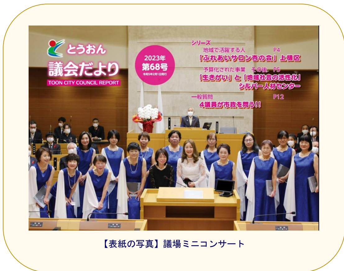
【表紙の写真】議場ミニコンサート