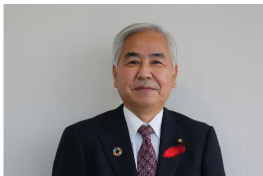
議長 丸山 稔（まるやま みのる）