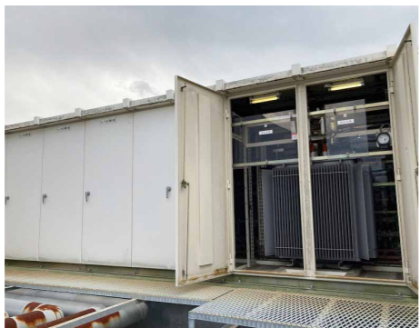
高圧受電設備（市庁舎屋上）

問 光熱水費のうち電気料金について、契約の相手先は。 答 本市の契約先は、四国電力のみである。 問 本庁や消防署等の光熱水費について、財源内訳は、一般財源になっているが、今後、値上げがあった場合も、一般財源で対応するのか。 答 今後、さらなる値上げがあった場合についても、国の補填等の情報がないため一般財源を充てる。