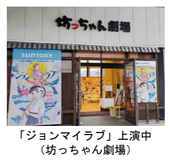
「ジョンマイラブ」上演中（坊っちゃん劇場）

消には至っていない。保育士・幼稚園教諭の配置基準の緩和については、人員体制を整えば、現場の意見を聞いて検討したい。