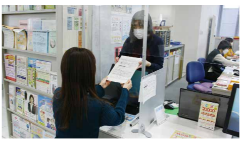
マイナンバーカードの交付（市役所1階）

②この制度は全ての事業者者に登録を義務付けているわけではなく、登録するかどうかは、事業者者に判断が委ねられている。取引先が消費者や免税事業者であった場合には、適格請求書の発行が求められるため、引き続き免税事業者となることも可能となっている。