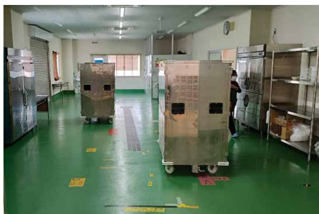
北吉井小学校給食配膳室

北吉井小学校教室及び給食配膳室等増改築工事 問 4教室から6教室に増築したが、今後のピーク時における教室等の使用見込みは。 答 令和4年度に1教室を通級指導教室として使用している。今後、1学級35人の定員を超える学年が出てくる可能性があるため1学級増を予定している。人数のピークを迎える令和7年度は、1年生から3年生の3学年で3学級増、難聴学級の1学級増となる。最大で6学級増の予定であるため、6教室の増築で充足される見込みである。