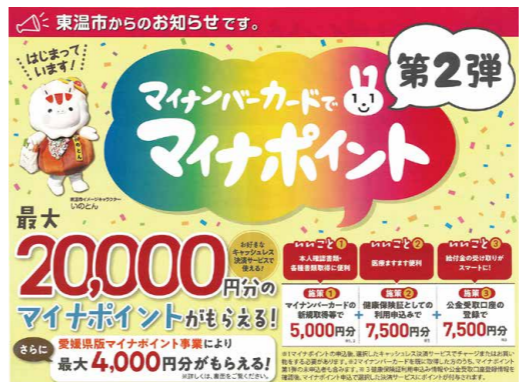
マイナポイントチラシ

問 市民の利便性の向上は。戸籍謄本等は本籍地でしか取得できないが、改修により、本人と直系の家族は、本籍地以外の市町村の窓口で取得できるようになる。 また、年金や児童扶養手当等の申請時の戸籍謄本の添付が、一部省略できるようになる。