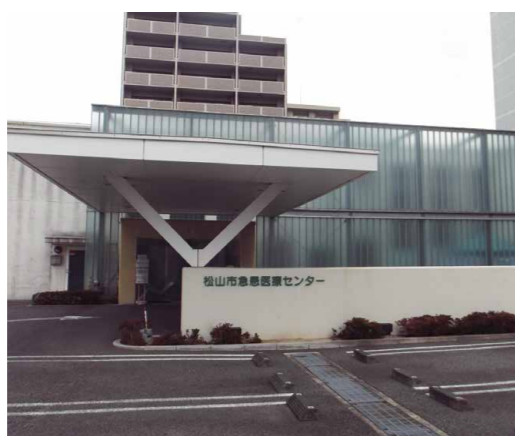
夜間診療をしている松山市急患医療センター

問 負担金増加の理由は。 答 センター負担金は、人件費や運営費が主で、診療報酬による収入を差し引いた額を中予地区の3市3町が負担している。令和2年度から新型コロナウイルス感染症の影響等で、受診控えがあり、診療報酬による収入が減ったため増加した。