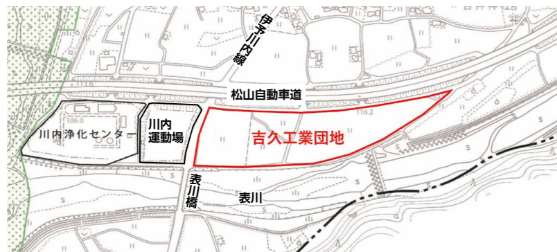
吉久工業団地計画図

問 両工業団地の総事業費は、それぞれ約13億円の事業規模を予定している。 問 借入の限度があるため基金から充当するのか。 答 総事業費に対して借入金額の限度額を超えていることから、基金からの充当での事業を計画している。