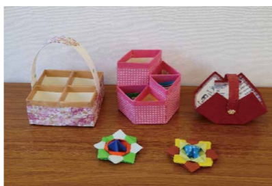
牛乳パックを使った小物入れ

◆「ふれあい・いきいきサロン」とは 地域においてボランティアと利用者が主体となり、高齢者、障がい者、児童、子育て中の親を対象に、自由な発想で活動をしています。福祉コミュニティづくりを推進することが目的です。東温市社会福祉協議会が支援して事業を行っています。