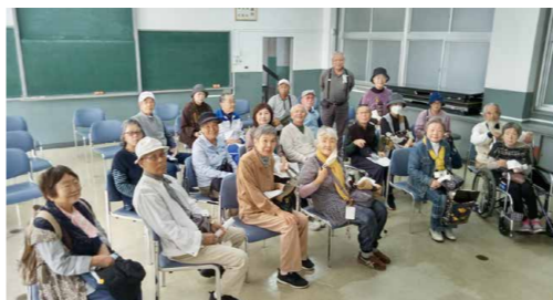
長浜高校水族館へお出かけ