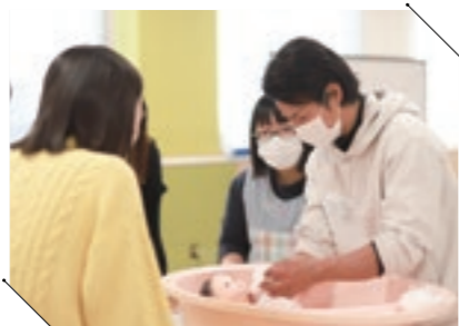
パパママ教室で、妊娠中のママとパパが沐浴体験。「思ったより難しかった」と試行錯誤していました。