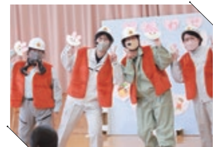
さくらこども館に賑やかな動物たちがやって来ました。ここでしか見れないお楽しみの時間です。