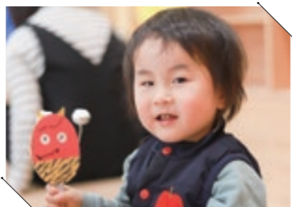
よしいのこども館の育ジョイタイムは節分。新聞紙の豆と手作りのでんでん太鼓で鬼を追い払いました。