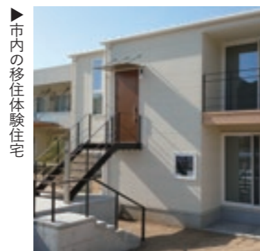
市内の移住体験住宅

移住の取り組みを進めています 東温市移住コンシェルジュです。東温市への移住相談や、市内アテンドの実施、移住に関する情報発信などを中心に活動しています。今年度は、南方にある移住体験住宅の運用も始まり、北は岩手県、南は沖縄県から利用者の受け入れを行いました。東温市の暮らしを体験し、移住後の生活イメージを少しでも掴んでいただいて、実際の移住へ繋げられるよう今後も取り組みたいと思います。その