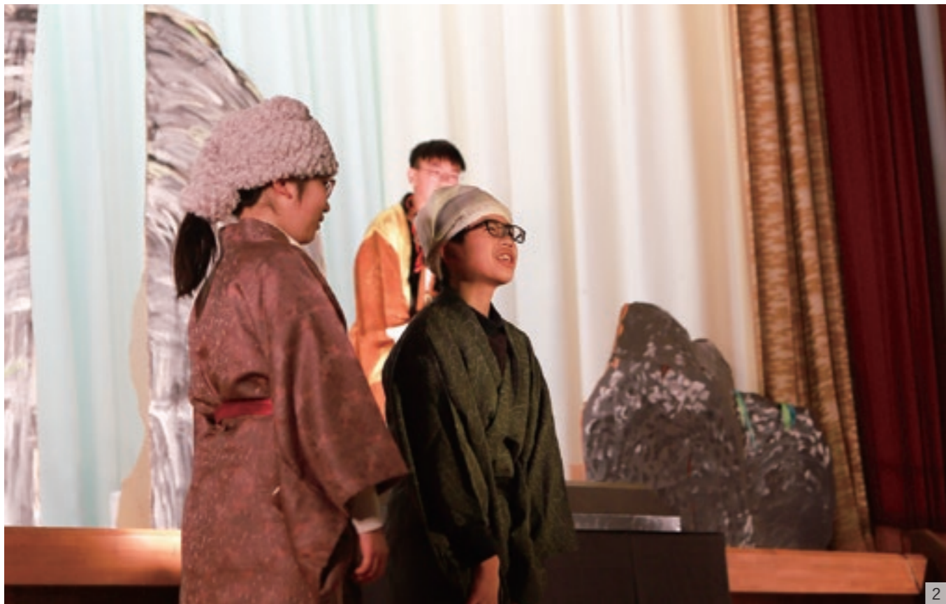
1_城山天満神社神楽保存会による「大魔」の演舞/2_5・6年生の劇の1コマ/3_城山天満神社神楽保存会の皆さん/4_6年生が切り合いの場面を体験/5_1・2年生が役を演じる/6_3・4年生は元気と笑顔溢れる劇を披露/7_5・6年生の教室に掲げられた言葉/8_上林の歴史が模造紙にまとめられた