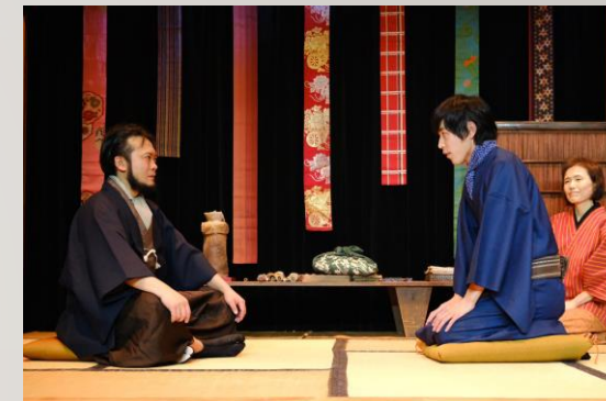
【近藤林内物語 運営支援・出演】