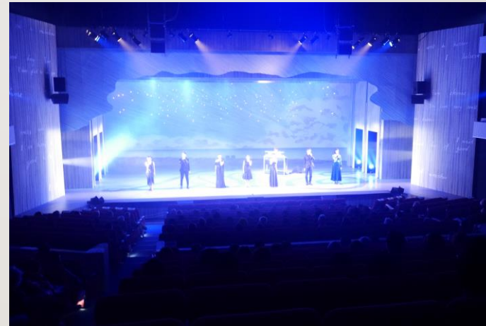
【ガラコンサート 運営支援】