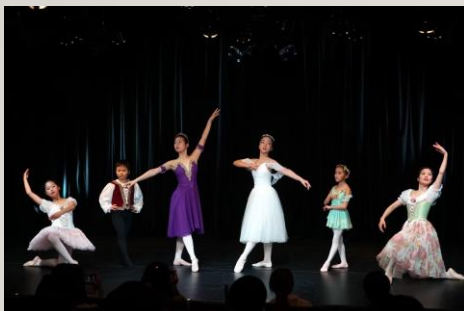
【とうおん舞台芸術アカデミー 第二回発表会 運営支援】