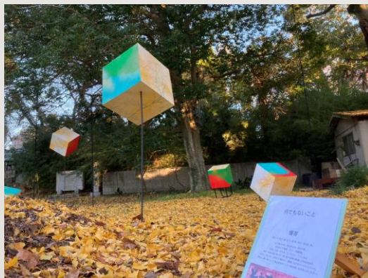
【東温アートストリート 運営支援】