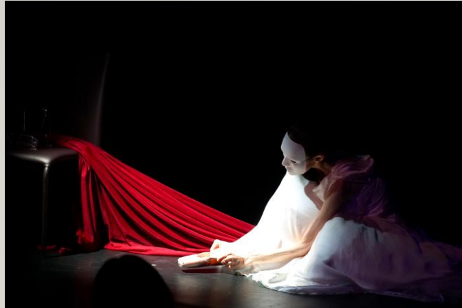
【ダンスダンスダンス 運営支援】