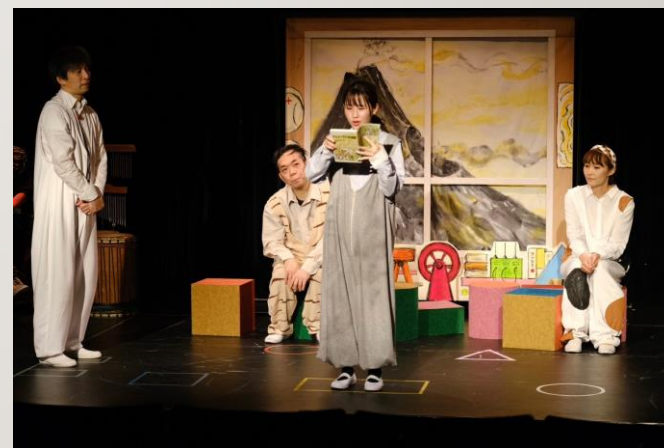
【猫のカツカザン事務所 運営支援】