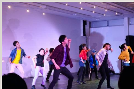
【とうおん舞台芸術アカデミー 第一回発表会 運営支援】