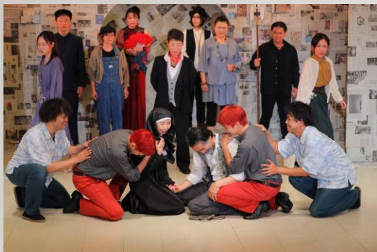
【伊予の国シェイクスピア 運営支援】