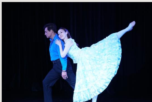
【東温アートストリート 運営支援】