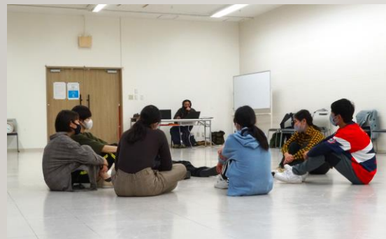
【teen × meetsエンゲキ 運営支援】