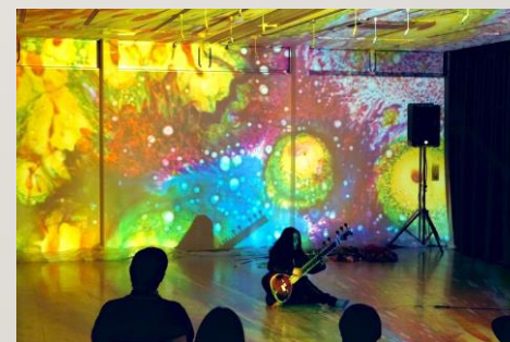
【アートヴィレッジライブ 運営支援】