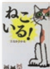
ねこいる! 著/たなか ひかる

絵本にある言葉は「ねこいる?」「ねこいた!」だけ。2歳から小学生まで幅広く楽しめる絵本で、読み聞かせするとみんなが笑ってしまう絵本です。