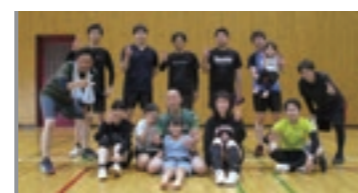
優勝した「NINELIVS」の皆さん