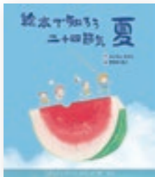
絵本で知ろう 二十四節気 夏 作/ふじもとみさと 絵/喜田川昌之

今月は「CREATOR'S FILE」で紹介した水田さんのオススメ本をご紹介します。