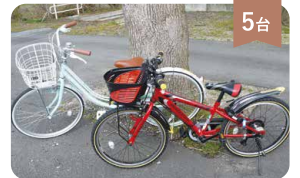
子ども用自転車 200円/1h