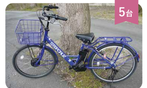
5台 電動自転車(かご付きタイプ) 400円/1h