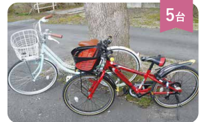
5台 子ども用自転車 200円/1h