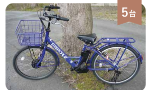
電動自転車(かご付きタイプ) 400円/1h