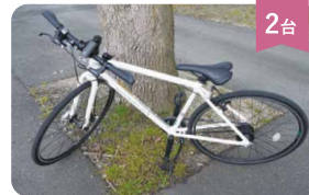
2台 クロスバイク 250円/1h