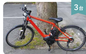
電動自転車(クロスタイプ) 400円/1h

ご利用の際は、東温市さくらの湯観光物産センター イトインスタッフへお声かけください