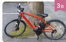
3台 電動自転車(クロスタイプ) 400円/1h

ご利用の際は、東温市さくらの湯観光物産センター イトインスタッフへお声かけください