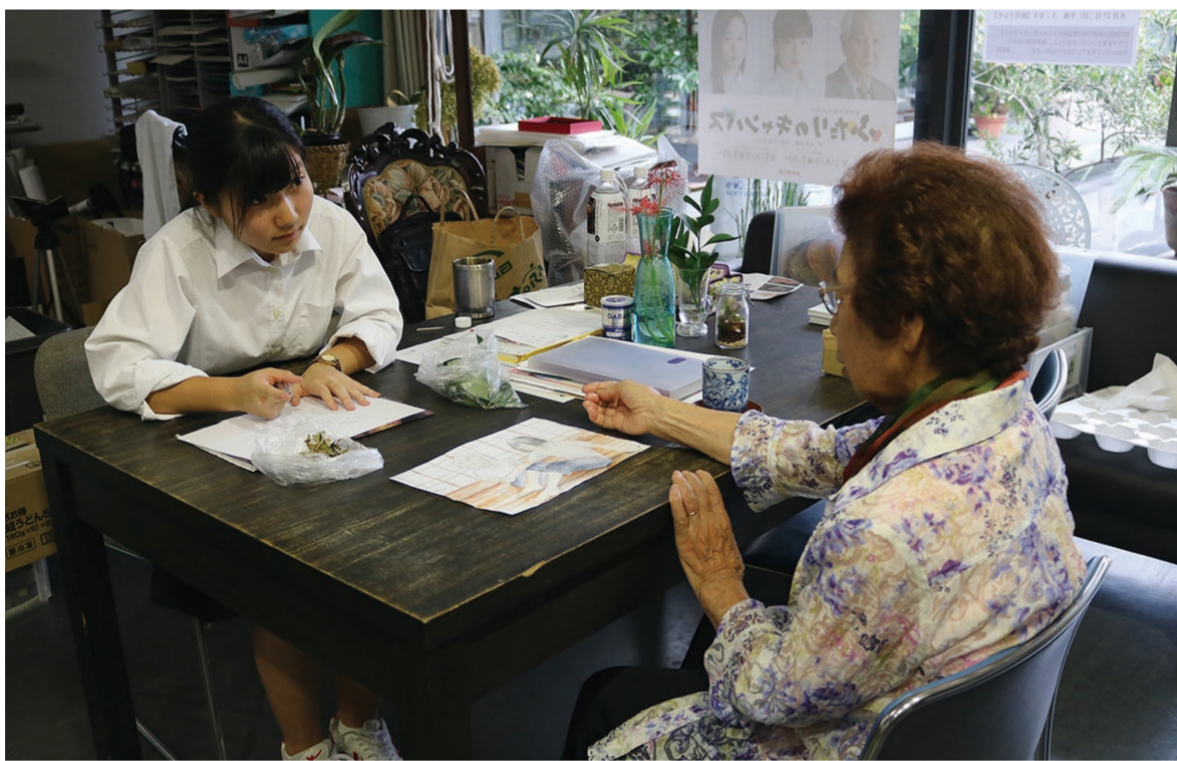
① 証言者の被爆体験を詳細に聴き取る。