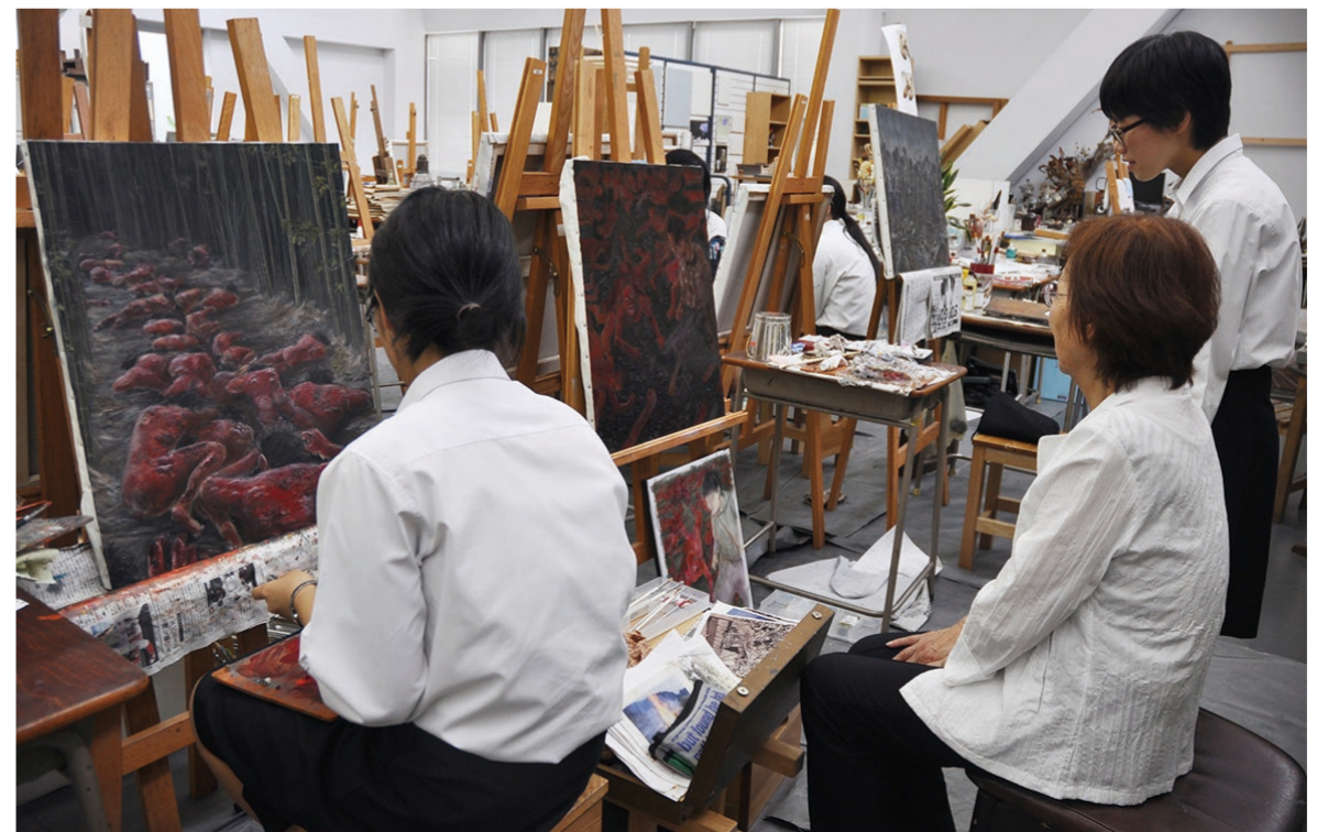
④ 1年の制作期間中、何度も証言者が絵を確認し、直しながら完成を目指す。