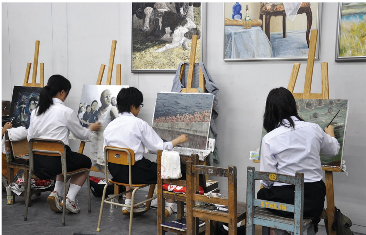
③ 色を重ねながら、光景を忠実に再現していく。