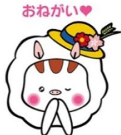
東温市イメージキャラクター いのどん