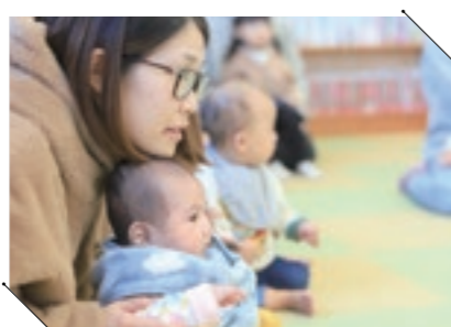
よしいのこども館のおはなし会。クリスマスにちなんだお話や手作りのペープサートを楽しみました。