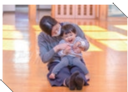
いわがらこども館で親子体操。お母さんとのスキンシップはとて楽しく、笑いが止まりません。