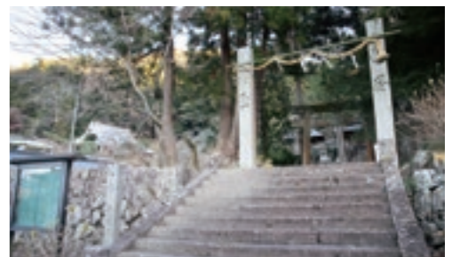
竜が飾られている惣河内神社。夏には紫陽花、秋には紅葉と四季を楽しむことができる

12月16日、惣河内神社に大きな稲わらでできた竜が展示された。全長は約12m、胴回りは70cm、背には米俵3体、左手は米の房を持ち、虹色の宝珠を啜え、尻尾に