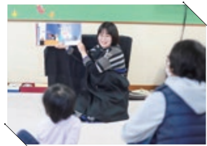
図書館ではおはなしウーフによる絵本の読み聞かせ会。冬に関する絵本に興味津々に聞いていました。