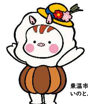
東温市マスコットキャラクター いんとん