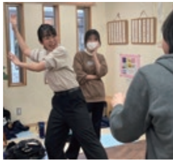
▲2月の演劇ワークショップ(主催: Feel Free)でのひとコマ