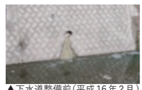
▲下水道整備前(平成16年2月)

毎年9月10日は、「下水道の日」です。川内地区では平成13年から、重信地区では平成17年から公共下水道による汚水処理を開始しました。下水道整備により生活排水が直接水路や側溝に排出されなくなるため、生活環境が向上し、安心して清潔な生活が送れるようになりました。この機会に下水道について考えてみてはいかがでしょうか？ ●上下水道課 ☎964-4416