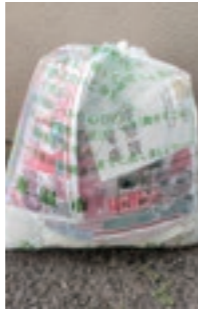
▲広告紙で大部分が覆い隠されているごみ袋

燃やすごみの中に紙類の混入が多く見られます。紙類で出していたければ、資源として再利用されます。燃やすごみの内袋の利用は、個人のプライバシーに関するごみについて一部認めていますが、袋の大部分が内袋や写真のように大部分を覆い隠すような目隠しはしないでください。また、生ごみは、よく水分を切って出してください