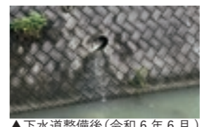
▲下水道整備後(令和6年6月)