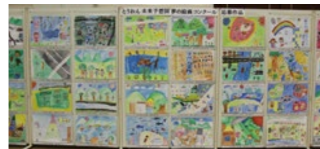
市誕生10周年記念式典の一コマ