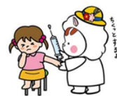
東温市イメージキャラクター いのどん

東温市では、定期予防接種を下記のとおりに実施しています。 対象年齢の方は予防接種についての説明書等をよく読み、接種を希望される場合は十分理解した上で体調のよい時に予防接種を受けましょう。