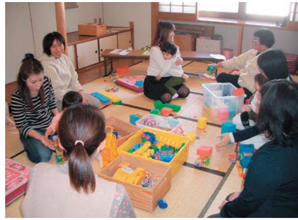
前回のファミサポ親子遊びの広場の様子