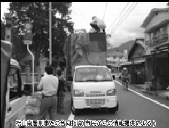
松山南署刑事との合同指導(市民からの情報提供による)

抜き取り業者は二人組が多いので、注意する時は相手より多い人数で臨みましょう。威嚇されて恐怖を感じた場合は、脅迫罪に該当する可能性があるため警察に通報しましょう。車の進路をふさいだり、車体や積荷に触れることは、危険であり逆に訴えられることがあるので注意してください。