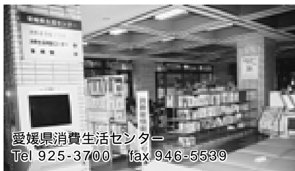
愛媛県消費生活センター Tel 925-3700 fax 946-5539

苦情の寄せられた商品について、原因究明が必要な場合はテストをします。また、消費者に生活科学の学習の場としてテスト室を開放し、皆さんが自分たちで行うテストの支援をしています。