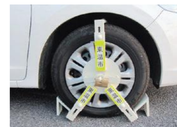
タイヤロックの例