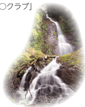
先月号の答え: 白糸の滝(しらいとんたき)