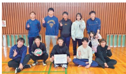
▲優勝した「socius」の皆さん

11月9日㊟に、農林業者トレーニングセンターで開催され、熱戦が繰り広げられました。