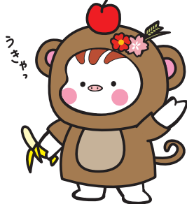
今年は申年(さるどし)です。

2016年、新しい一年が始まりました。表紙の写真は上林地区で飾られている大きな門松の写真です。新年を祝う巨大な門松、今年は一体どんな一年になるのでしょうか。皆さんにとって幸せな一年になりますように。