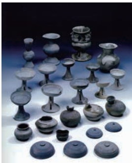
▲向井古墳出土遺物

のままとされる状態で発見さ れた須恵器の一群は、古墳時 代後期の葬送儀礼を考える上 で、重要な資料です。 これらの出土遺物は、歴史 民俗資料館の第 1 展示室に展 示しています。