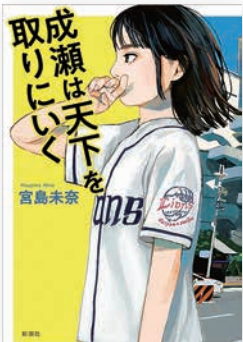
成瀬は天下を取りに行く 著／宮島未奈

今月は、図書館本館、川内分館、かぼちゃん号合わせて、 昨年 1 年間で最も多く借りられた本を紹介します。