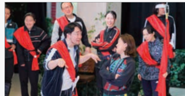
▲伊予の国シェイクスピア第3弾の様子

市民が主役のシェイクスピア劇を開催します！ ◇日時…2月21日④18時30分、22日⑧11時/17時、23日⑧11時/17時◇会場…東温アートヴィレッジセンターアトリエNEST◇料金…一般2,500円（中・高生1,500円）※当日+500円、小学生無料、未就学児入場不可★全席自由◇予約…右記二次元コードから予約してください。 ⑧泰☎090-7571-8692