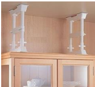
ツっぱり棒タイプ