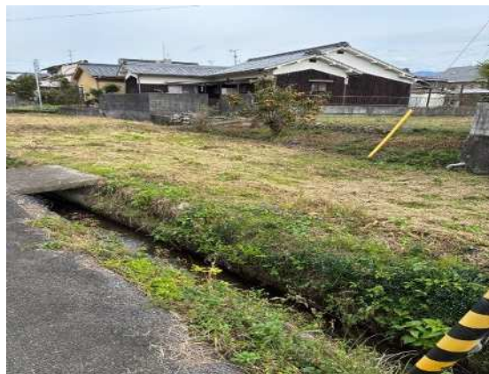
① 甲573番1、② 甲572番2 西側から撮影