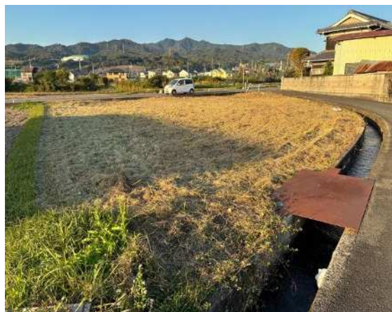
④ 甲1248番1 南側から撮影