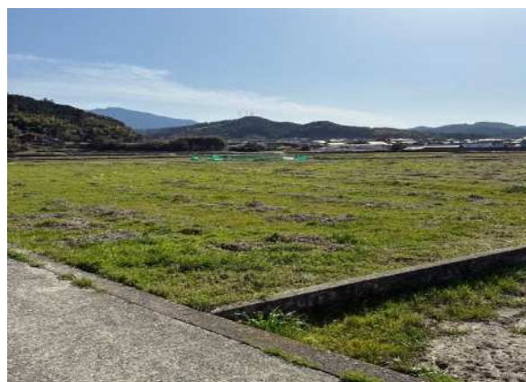
② 4 7 4 番 1