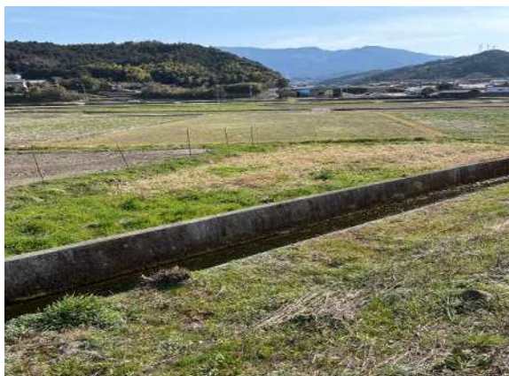
① 4 6 8 番 1