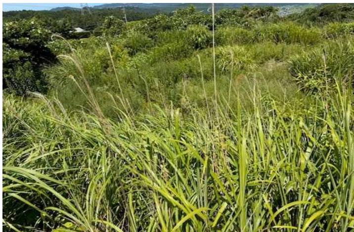
⑤ 字東涌水甲276番1 南側から撮影