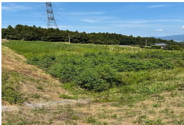
③ 字柵甲229番1 南東から撮影