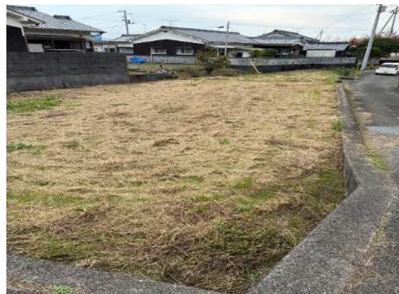
③ 573番5 東側から撮影