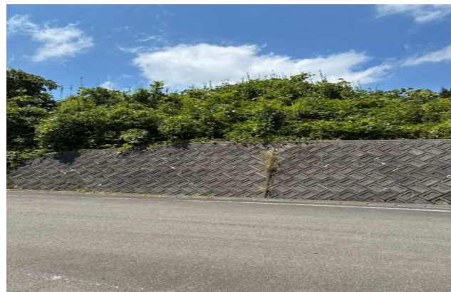
② 字柵甲209番3 道路側から撮影