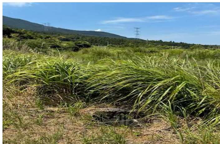
⑤ 字東涌水甲276番1 南東から撮影