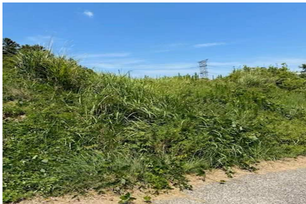
① 字柵甲209番2 道の農道手前から撮影