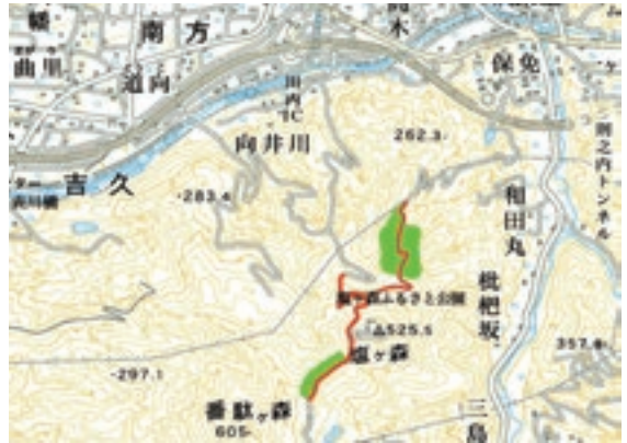
◀赤色・緑色箇所散布します。