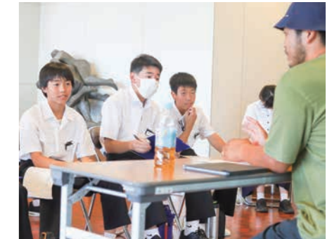
▲「自分の技術をいくらかお客さんに提供するか」について話をしてくれました【スケートSHOP BG】