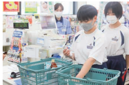
▲レジ打ち体験【ドラッグセイムス 東温南方店】