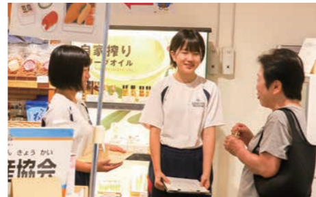
▲お店に訪れた人と笑顔でコミュニケーション【さくらの湯観光物産センター】