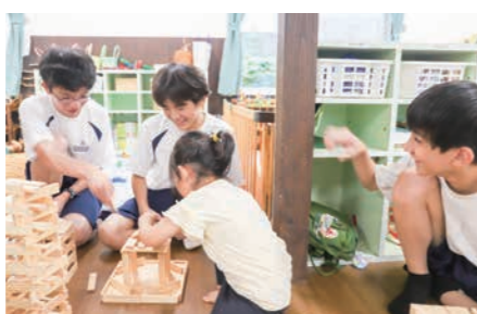
▲子どもたちと笑顔で積み木遊び【むぎの穂保育園】