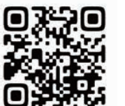
東温市誕生20周年記念特設サイト

記念式典や市民ミュージカルなど、20周年記念事業の情報や、市にゆかりのある方からの祝いメッセージ、市の20年のあゆみなどを掲載しています。情報は随時更新予定ですのでぜひチェックしてください。