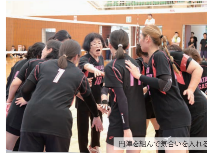
円陣を組んで気合いを入れる