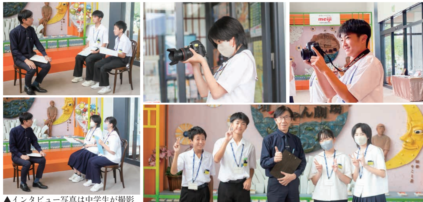
▲インタビュー写真は中学生が撮影