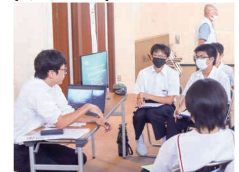
▲弱い立場の人を助けるには、どうしたらいいか話をしてくれました【とうおん法律事務所】