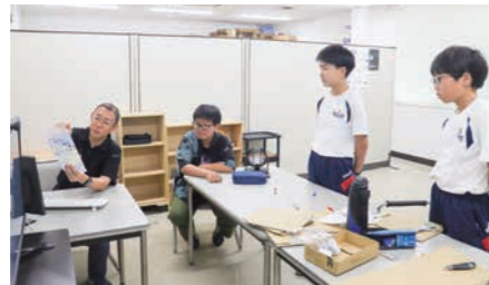
▲アドバイスを受けながら、チラシ制作【日本ディーアルシステム(株) (てんとむし)】