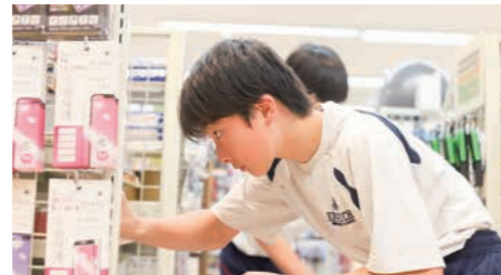
▲商品の陳列【シルク ケールズモール店】