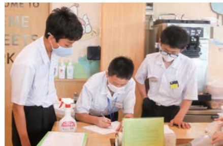
▲お菓子の仕入数を確認【(株) 母恋夢】