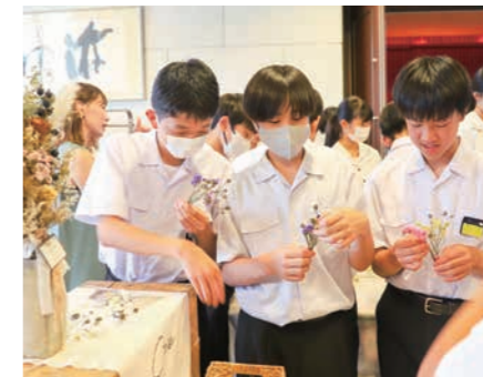
▲ドライフラワーアレンジメントを体験しました【core】