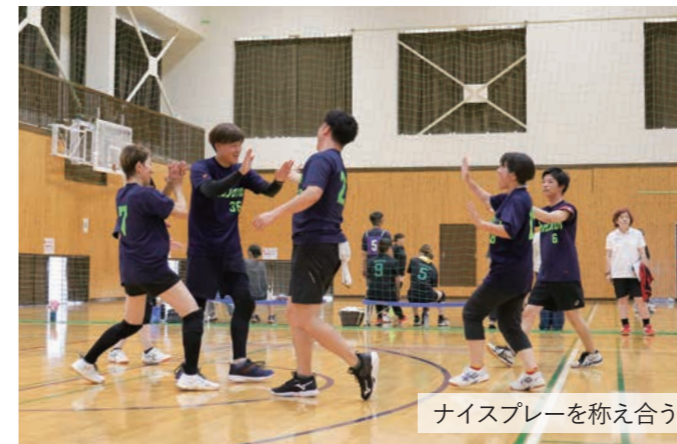
ナイスプレーを称え合う