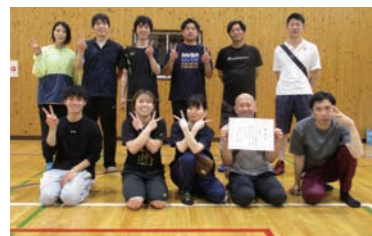
優勝した「NINELIVS」の皆さん