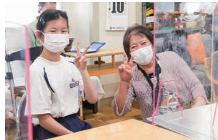
▲交流で仲よし【愛媛十全医療学院附属病院】