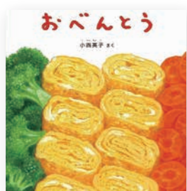
おべんとう 作/小西 英子

お弁当箱の中をホカホカの白ご飯とおかずを詰めて、お弁当を完成させるお話です。お弁当箱に次々とおかずを詰め込む様子と、まるで本物の食べ物のような絵が魅力で、親子で楽しめる絵本です。また、ページ数が少ないため、初めて絵本を読む方にも読みやすい1冊です。ぜひ、手に取って親子で楽しんでみてください。