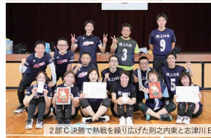
2部C 決勝で熱戦を繰り広げた則之内東と志津川B