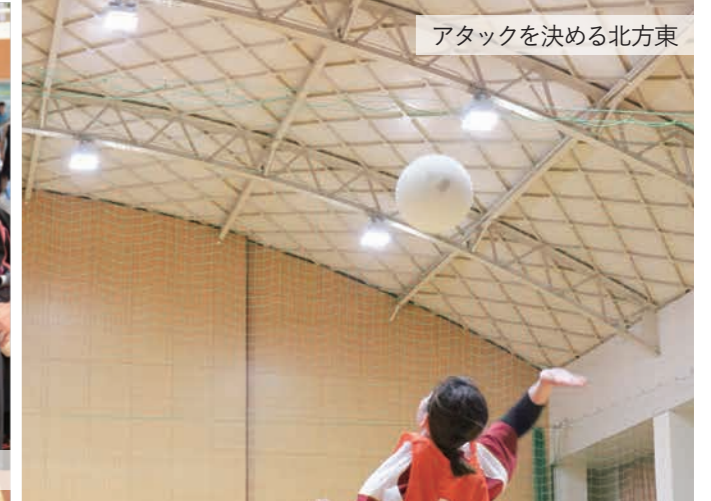
アタックを決める北方東