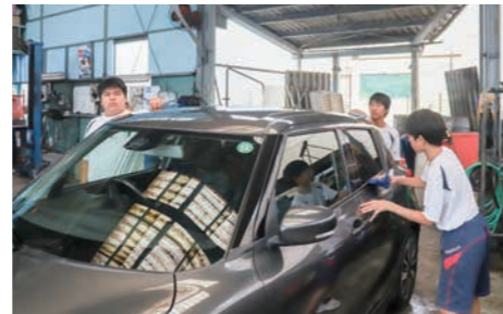
▲自動車の拭き作業【中島モーターズ】