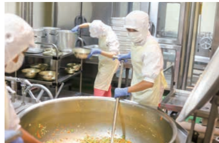
▲給食作りに挑戦【学校給食センター】