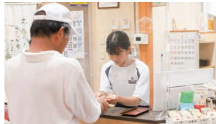
▲入浴利用者に接客【ふるさと交流館さくらの湯】