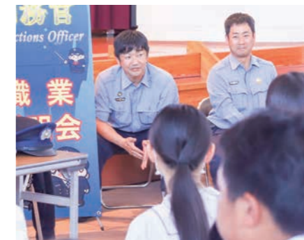
▲普段知らない刑務官の仕事について話をしてくれました【松山刑務所】