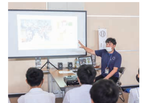
▲「その人らしさ」を大切に支援について話をしてくれました【ウェルケア重信】