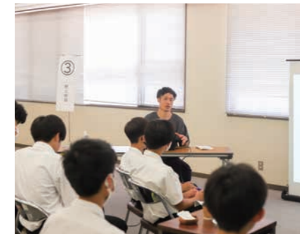
▲元地域おこし協力隊員が、本をゆっくり読める憩いの場作りについて話してくれました【駅と珈琲】