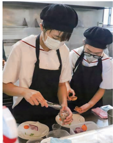
▲協力してイタリア料理をおしゃれに盛り付け【フィレンツェ】