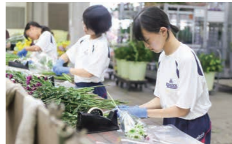
▲菊バック作り【(株) あぼんりー】