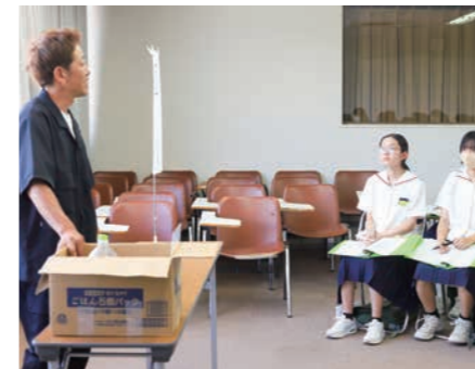
▲中学生から現在まで半生を振り返りながら、仕事や夢について熱く話してくれました【いちご日和】