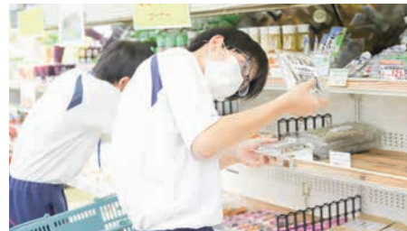
▲商品棚の清掃と商品の期限切れをチェック【レスバスコオペレーション いしづち山麓マルシェ】