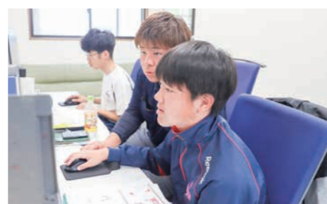
▲パソコンで設計図作り【(株) 富久】