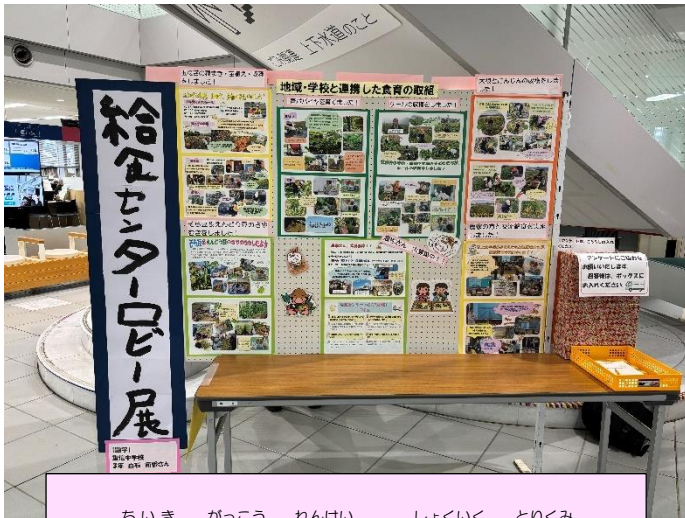
ちいき がっこう れんけい しょくいく とりくみ 地域・学校と連携した食育の取組

地元農家さんのご協力のもと、園児・児童・生徒 が豆のさやむきやにんじん・大根・玉ねぎ・ケール・ 青パイアの収穫体験を行い、その時の様子を 紹介しました。