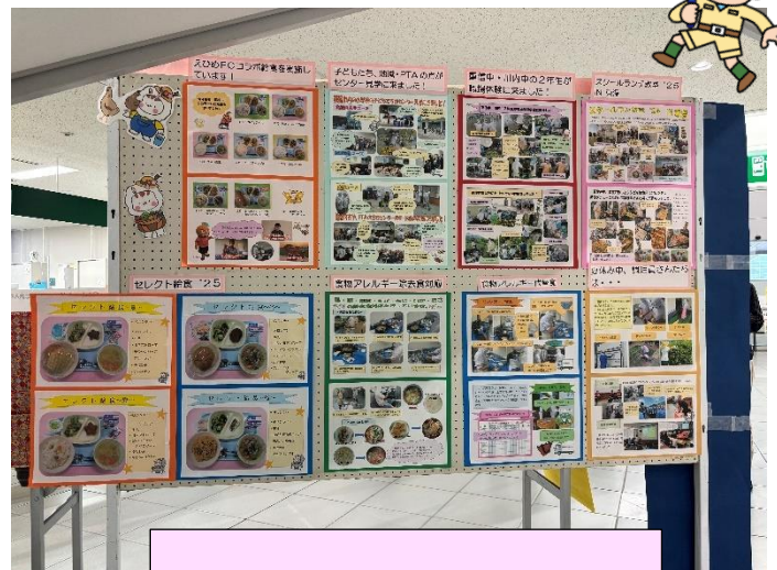
きゅうしょく センターの取組

地元農家さんのご協力のもと、園児・児童・生徒 が豆のさやむきやにんじん・大根・玉ねぎ・ケール・ 青パイアの収穫体験を行い、その時の様子を 紹介しました。