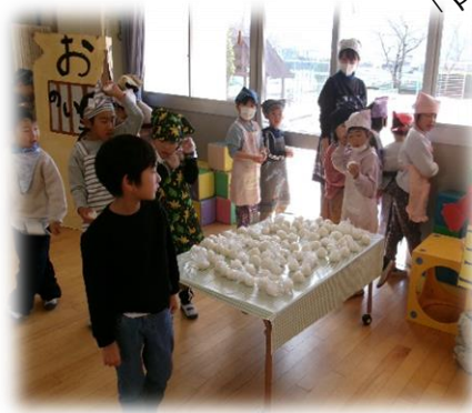
〈おにぎりパーティー〉