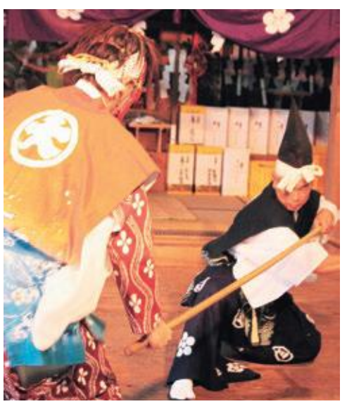
伝統の舞 上林 里神楽

6月26日、拝志小学校で「砂防学習会」が開催されました。これは、降雨体験装置や土石流3D体感シアターなどの体験を通じて、土石流害についての知識や理解を深め、自分の命は自分で守る姿勢と技能を育てるため、国土交通省、県砂防課、県砂防ボランティア協会などの協力により実施されたものです。 体験した児童は、「降雨体験では頭が真っ白になりました。もしもの時のために、通学路で危ない場所を確認するなど普段から気をつけて生活したいです」と話しました。ご家庭でも災害時の行動について話し合ってみましょう。