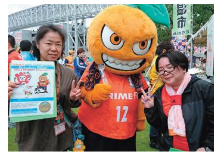
熱い試合でCOOLにCHOICE! 愛媛FCと地球温暖化対策を推進

6月23日に開催された愛媛FCホームゲームで、市が推進する地球温暖化対策のための国民運動「COOL CHOICE」(賢い選択)の賛同を来場者に募り、賛同いただいた660人の方に、特製ボールペンやクリアファイルがプレゼントされました。 COOL CHOICEは、一人ひとりが身近に出来る地球温暖化対策を推進しています。食べ残しをしない、無駄な電気は消す、公共交通機関を使うなど、普段の生活の行動を見直して、地球に優しいエコ生活を始めましょう。