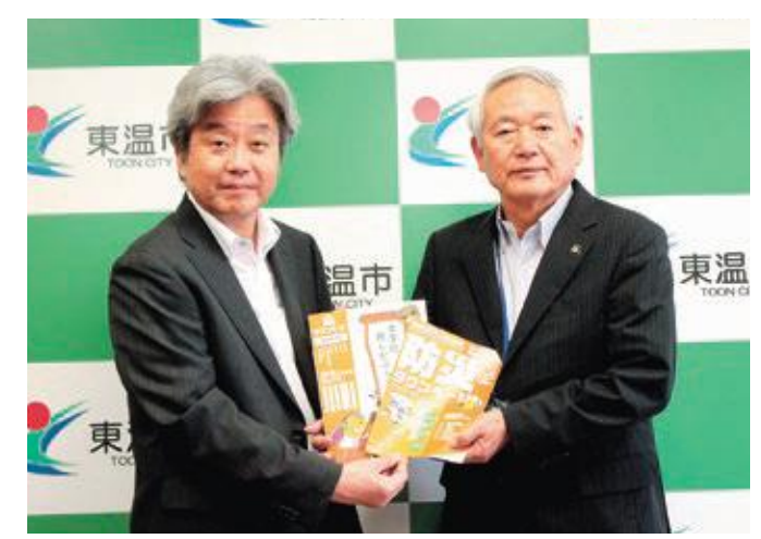
一人でも多くの防災意識向上を 防災タウンページ配布

7月4日、フジグラン重信(野田)とフジ見奈良店で、第68回社会を明るくする運動の啓発活動が行われました。これは、国や自治体、市民ボランティア団体が力を合わせて、「犯罪や非行からの立ち直りを支えていく。更生保護」を広めるもので、参加者は地域社会の中で受け入れられる居場所の必要性を訴えるパンフレットを配布し、「社会に帰る場所をつくり、私たちの暮らす地域を、より安全で安心なものにしていきましょう」と訴えました。