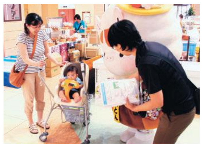
あなたのまなざしで 再出発を見守る社会へ

7月4日、フジグラン重信(野田)とフジ見奈良店で、第68回社会を明るくする運動の啓発活動が行われました。これは、国や自治体、市民ボランティア団体が力を合わせて、「犯罪や非行からの立ち直りを支えていく。更生保護」を広めるもので、参加者は地域社会の中で受け入れられる居場所の必要性を訴えるパンフレットを配布し、「社会に帰る場所をつくり、私たちの暮らす地域を、より安全で安心なものにしていきましょう」と訴えました。