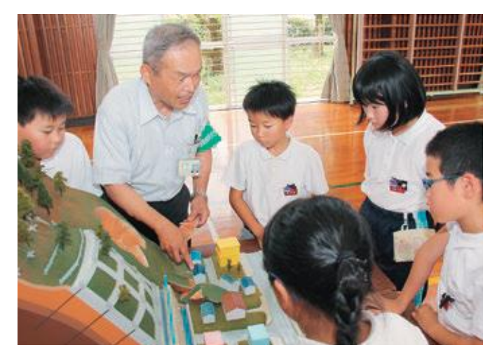
体験から学ぶ もしもの備え 拝志小学校 砂防学習会

市内中小零細企業の人材不足の改善と、学生の地元就職・定着を図ろうと、愛媛大学や東温市観光物産協会、市商工会が連携して、企業紹介冊子の作成を始めました。大学生は3班に分かれて市内企業を訪問し、各企業が持つ特性や技術、福利厚生制度、職場の雰囲気などについて、「働く未来の自分」をイメージしながら熱心に取材。求職者側である大学生の視点で編纂される冊子は、年度内に完成予定で、県内はもちろん中四国、九州、近畿などの大学・専門学校等に配布されます。