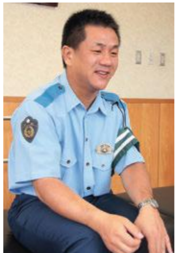
愛媛県松山南警察署 交通課交通係長 平岡 雄介 警部補