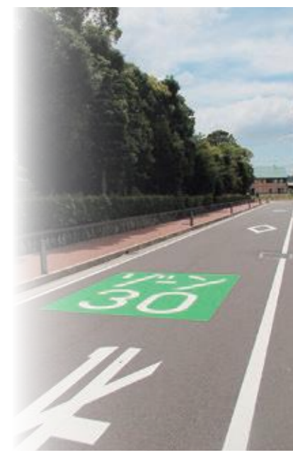
志津川南地区ゾーン30標示