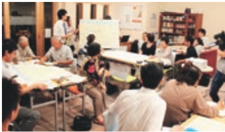
班に分かれて、感想や印象に残ったことを共有しました。

お互いを認め合い、立場・見解を超え、着地点を見出していく。そこには『沸き立つ強い地域』の姿があります。