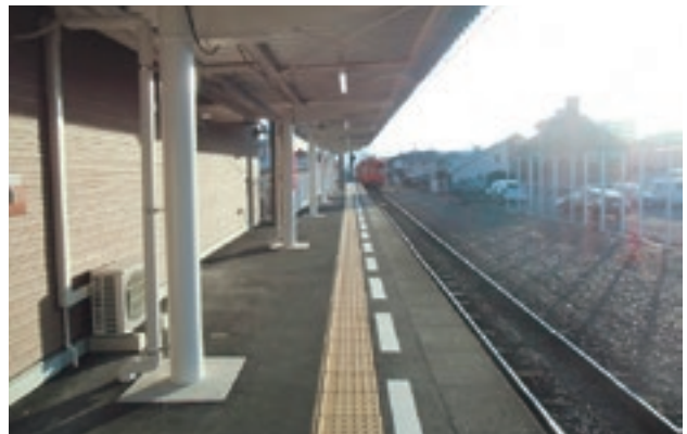
鉄道駅のバリアフリー化が進んでいます！

市外の人にも分かりやすいように市内の公共交通情報をまとめた冊子を作成し、情報発信します。