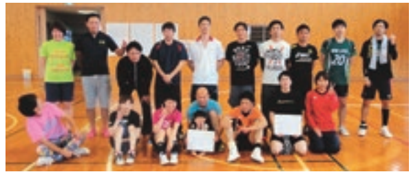
優勝した「NINE LIVES」の皆さん

6月5日(日)、川内体育センターにて『男子親睦バレーボール大会』が開催され、参加7チームが熱戦を繰り広げました。