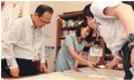
第1回目のテーマは「相互理解」。