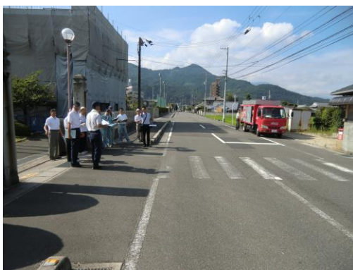
平成 24 年度に行われた東温市通学路合同点検実施状況