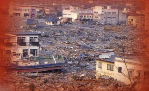
平成23年 東日本大震災