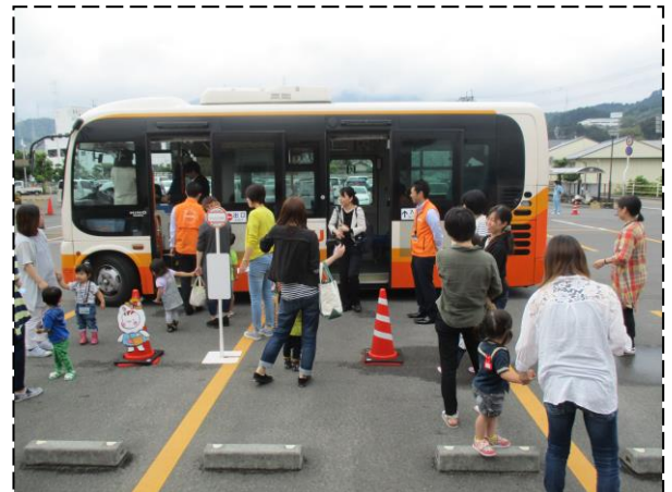
路線バス体験教室 (あおぞら広場)