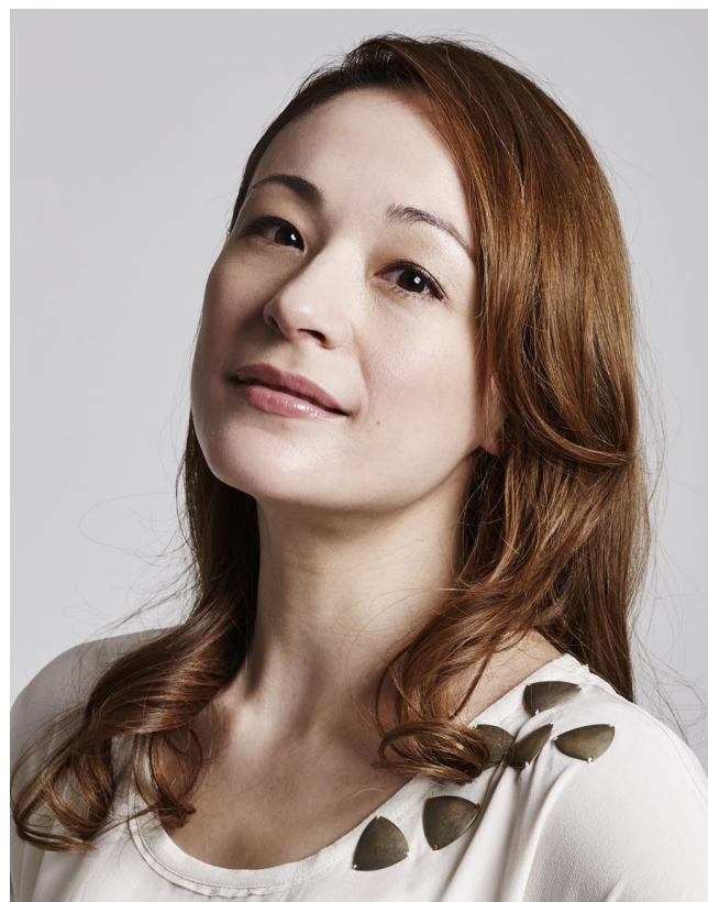
シルビア・グラブ