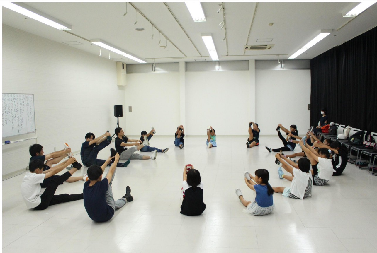
キッズミュージカルワークショップの様子