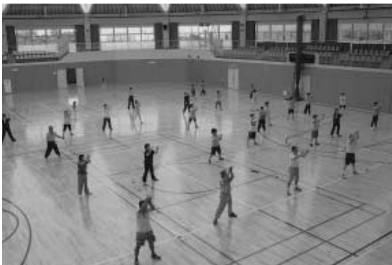
ツインドーム重信でエアロビックダンス