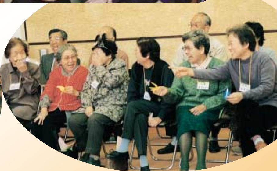
初めて開催“ふれあい広場”(11/12 町民会館)