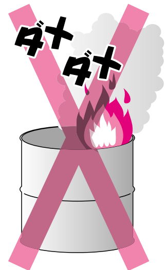
ドラム缶を使っての野焼き