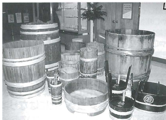
たがを締め直して並ぶ