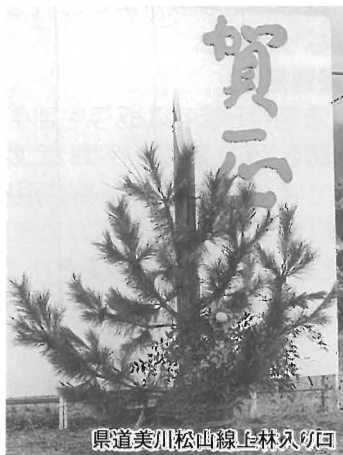
県道美川松山線上林入り口

今年も年末が近づいた12月中旬、帰省する方々を温かく迎えようと地域の有志が約半日かけて二つの門松を完成させました。