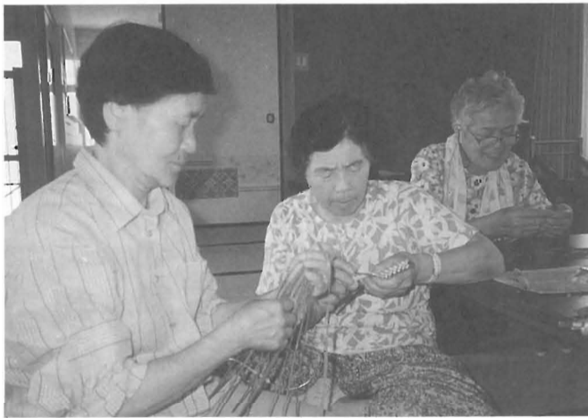
ハーブスティック作り