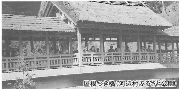
屋根つき橋(河辺村ふるさと公園)

県下でも最大規模の清流肱川に沿って走り、紅葉には少し早い鹿野川湖を過ぎ、城川町の全国かまぼこ板の絵展覧会場に着きました。係員から展示方法や見所などを聞き、展示室に入りました。