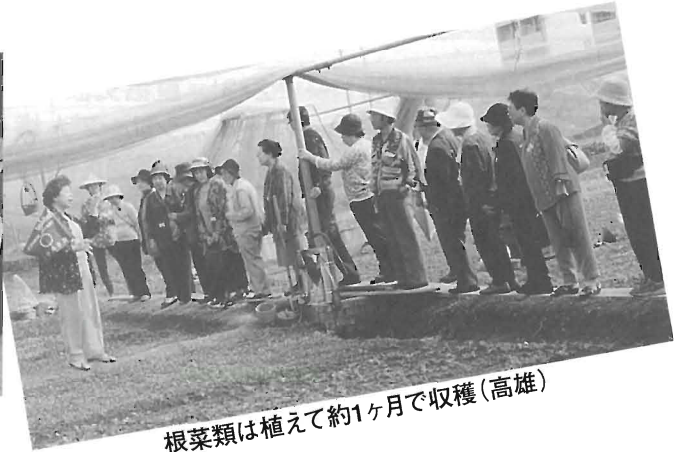
根菜類は植えて約1ヶ月で収穫（高雄）