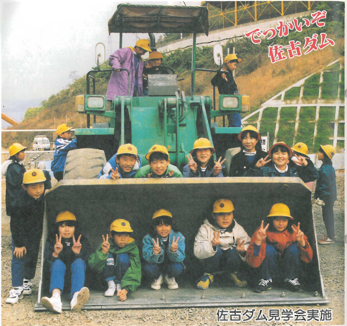
佐古ダム見学会実施