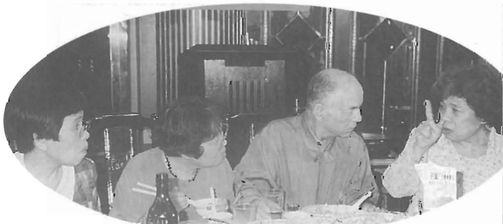
「日本語ダイジョブ」盛り上がった交流パーティ

旅を終えて、一番大きな収穫は、三泊四日を共にした重信町民同士の交流であったかもしれない。同じ町にいながら、お互いをよく知らない存在であったように思う。台湾が近くて遠い地であると思われていたように……。