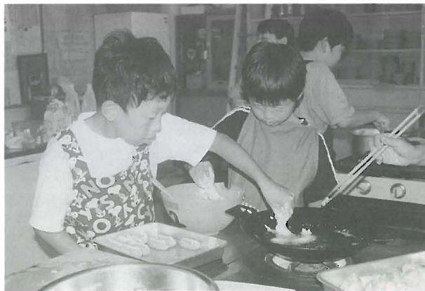
親子料理に参加して、とても楽しかったです。お母さんと一緒に作って食べられるのがとても嬉しかったです。

わたしは、はじめての料理教室に参加して、とても楽しかったです。お母さんと一緒に作って食べられるのがとても嬉しかったです。