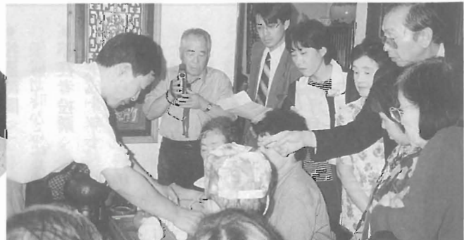
本場烏龍茶の入れ方を手ほどき