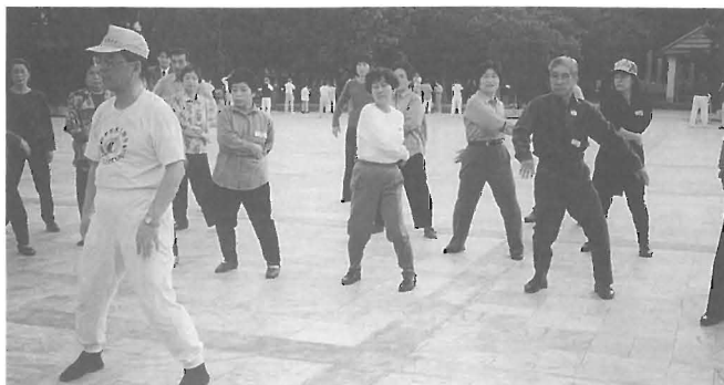
現地の人と太極拳で交流（台北）