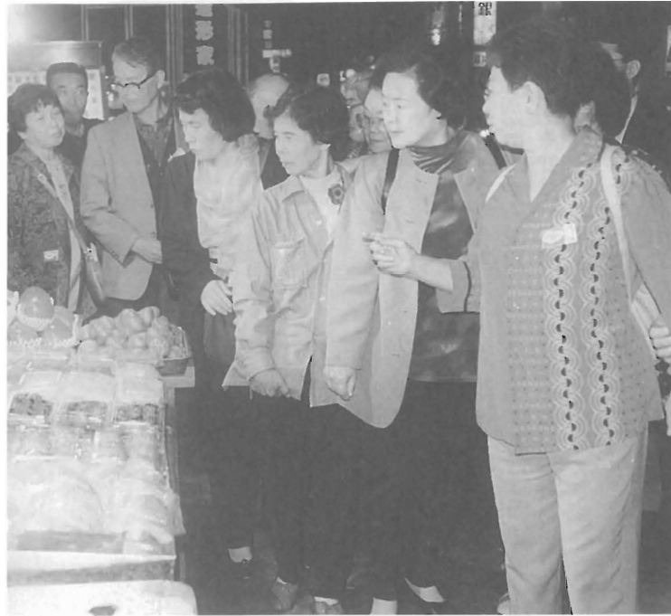
屋台が立ち並ぶ六合二路を散策(高雄)

かなり、ハードな日程でしたが、全員が無事に旅行を終えることができました。 「再来、台湾」