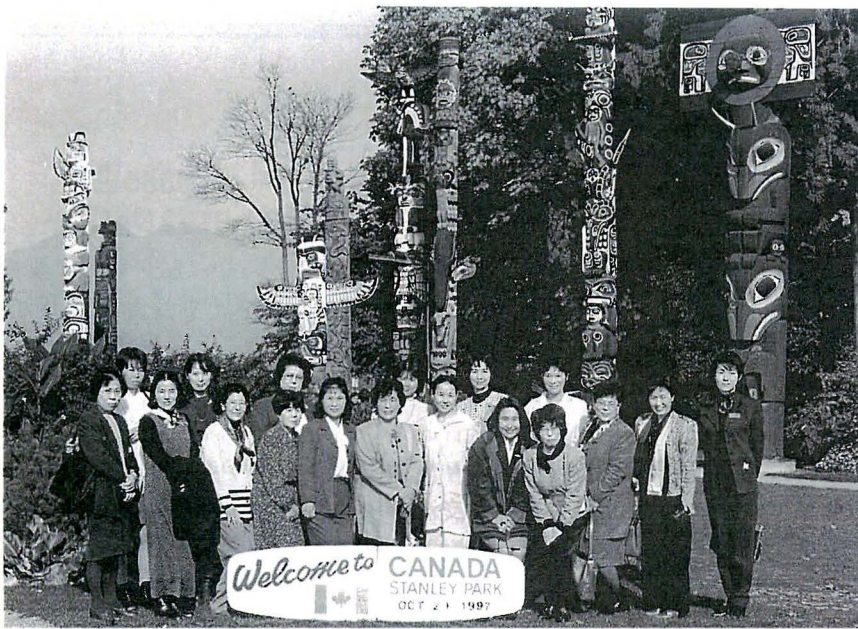
今回の事業の参加者全員で(スタンレー公園)

海外研修者募集のことを広報で知り、日本の外から四国や愛媛を見たり感じたりしたいと思い、応募しました。十月十六日、澄みきった青空のもと、成田空港からカル