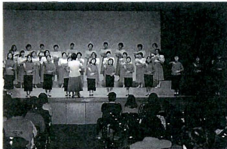
重信コーラスと手話サークルの共演