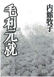
「毛利元就」(下) 内館牧子 日本放送出版協会

小学生だったあのころには、爆笑とともによみがえるおかしな出来事がこんなにいっぱい。気楽で濃密なエッセイに、おまけのページも付いてちよつとうれしい一冊。