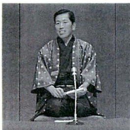
「こばなし」(かくし芸大会より)