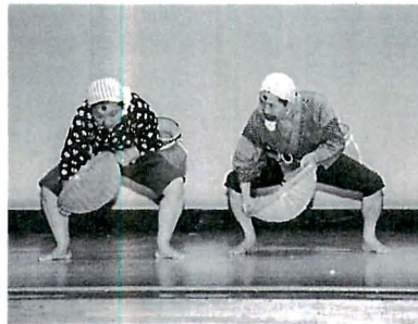
どじょうすくい男踊り