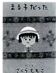
「まる子だった」 さくらももこ 集英社

小学生だったあのころには、爆笑とともによみがえるおかしな出来事がこんなにいっぱい。気楽で濃密なエッセイに、おまけのページも付いてちよつとうれしい一冊。