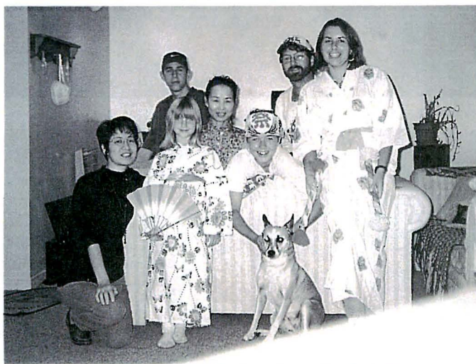
ホストファミリーに浴衣をプレゼントしました(左端)

の教育もしており、子育てで法や就職の為の技術習得も手助けしています。 二泊のホームステイは、一般家庭に溶け込み、寝食を共にして、少しですが文化交流ができたように思います。また、観光旅行では得られない大きな感動も得ました。持参した英語版の「坊っちゃん」を中学生の息子さんが楽しそうに読み、奥さんと娘さんが浴衣を喜んで着て下さいました。人種の多い国だから、外国人に対して寛大で優しく、偏見を持たないお国柄だと感じました。