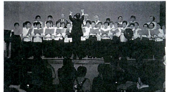
「童謡の会」によるコーラス