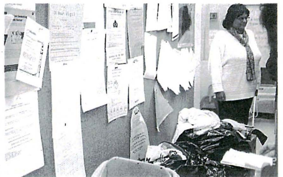
YWCAクラブトリーコーナー入口(衣服が寄付されている)

で、一九七六年に設立され、ヘルパーサービスはあるが基本的には自立した生活の出来る方々が、家賃を払って入居しています。現在、入居者の平均年齢七十七歳、九十歳以上の方が二十五名いて、カルチャークラブも充実、日本文化に関するものが多くあります。運営はほとんどボランティアで、カナダ政府からの補助もあり、現在は四百名の入居待ち状態という人気だそうです。入居費は、年収二万八千ドル以上の方は、一ヶ月八百ドル。それ以下の年収の方は、年収の三十%を収めます。(二ドル約九十円)