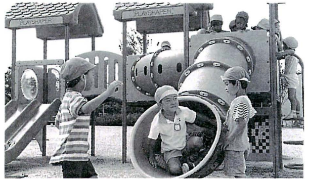
重信町総合公園で遊ぶ子供達

この公園を気持ちよく使っていたくために、公園内のゴミの持ち帰りや、施設を傷めないようご協力をお願いします。