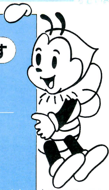
▲愛媛県国民年金マスコット・キャラクター「ゆめはちくん」