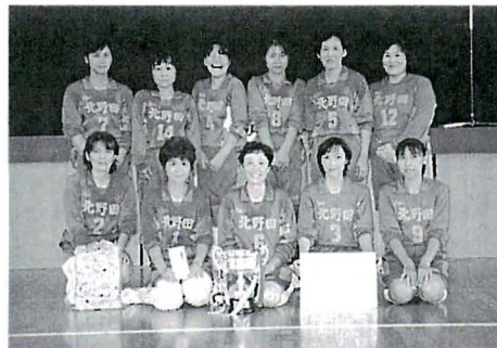
女子東ブロック優勝 北野田