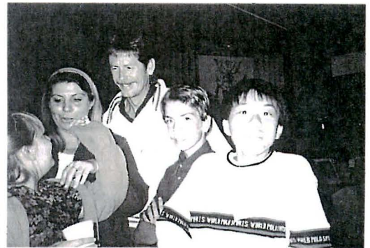
素敵な思い出をくれたホストファミリー

千枚のタイルを張った屋根は、ヨットの白い帆のようであり、白い貝殻のようにも見え、その向こうにはアーチ形のハーバー・ブリッジがありました。観光することができ、とても感動しました。 今回の経験をいかし、今後もっと世界に目を向け視野を広げていきたいです。 最後に、この旅行関係者の皆様に感謝したいと思います。本当にありがとうございました。