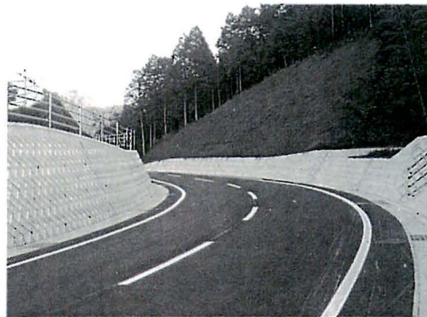
別府佐川線(下林)完成

道路改良工事については、志津川御伽線、田窪療養所線、平松上樋線、別府佐川線、パイパス砂子線、上村津吉線他都市下水道については樋口地