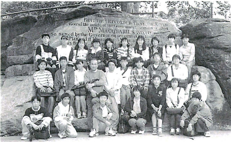
海外派遣事業に参加した仲間達と(中央列左端)

ることができました。交流を通して見聞を広めることができ、自分にとって心の財産となりました。 オーストラリアでの最後の三日間は、オリンピック開催予定地であるシドニーで過ごしました。十九世紀の歴史的建造物や高層ビル群などがあり大都会でした。一番印象に残ったのは、世界的に有名なオペラハウスを見学したことです。完成に十四年かかったそうです。太陽に反射する一〇五万六