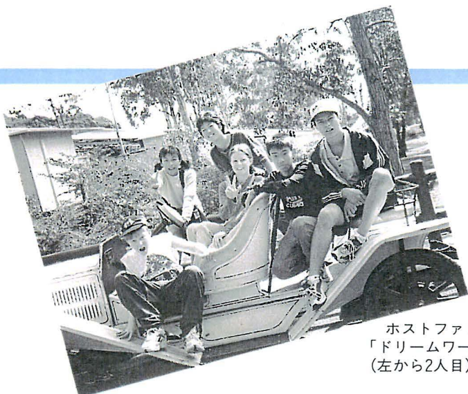
ホストファミリーと「ドリームワールド」へ (左から2人目)

生まれて初めて海外へでた私、二週間の旅でした。知らない国への好奇心や、驚き、言葉への不安を感じました。そのことよって得たものは、大きかったと思います。飛行機の中で一晩を過ごし、薄明るい朝のオーストラリアに着きました。日本とは赤道をはさんでいるのでこちらは冬です。少し肌寒い中、バスで町へ向かいました。人や犬、馬までが散歩を楽しんでいます。かわいなお店がたち並んで明るい町並です。かと思えば鏡のように空のうつる大きなビルが目の前にそびえたついたりします。都会と田舎町をごちゃ混ぜにしたようなところだと思いました。