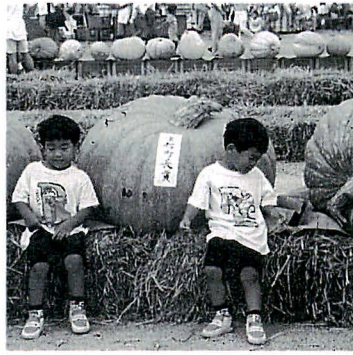
「ぽくとかぼちや、どっちが大きい?」