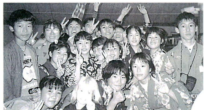
浴衣でさよならパーティ (前列右端)

その日のうちに学校へ行き、これからお世話になるホストファミリーと対面しました。予想はしていましたが、会話の難しいこと。一緒に歩いているときや車の中、食卓で、沈黙をつくってしまいます。しかし、ホストファミリーは一生懸命その沈黙を破ろうとしてくれました。みんなで簡単な文に直してくれているのがよく分かりました。私はずもつと話しかけていこうと思いましたが、日がたつにつれて、手ばなせなかつた辞書がなくとも会話できるようになりました。分らないところは身ぶり手ぶりで充分です。日本とオーストラリアの学校制度についてや家族のこと、食べ物のことなど、いろいろなことを教えあいました。会話が