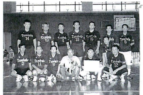
男子西ブロック優勝 田窪団地