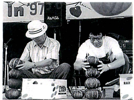
▲お父さん、真剣です 「かぼちや重ねゲーム」