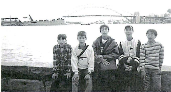
オペラハウスをバックに(右端)