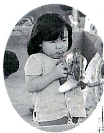
▲子供達に大人気 「ミニ動物園」