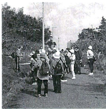
平成8年度ハイキング

六十番横峰寺(西条市)から六十一番香園寺(小松町)までの約十kmの緩やかな下りの行程をハイキングします。お気軽にご参加下さい。