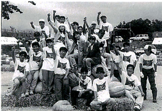
▲かぼちやピラミッドで恒例の記念撮影